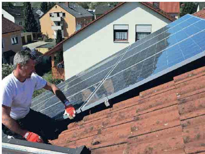
Der qualifizierte Dachdecker prüft die Befestigungen der Solarmodule und begutachtet die Unterkonstruktion im Rahmen des DachChecks.