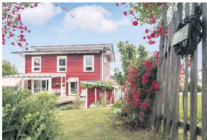
Wohlfühlwohnen gelingt in einem individuell geplanten Holz-Fertighaus sicher.

Die meisten Fertighäuser werden schlüsselfertig in Auftrag gegeben. Das heißt, die Baufamilie hat im Planungsprozess umso mehr Bau- und Ausstattungsentscheidungen zu treffen. Dafür erhält sie schon weit vor Baubeginn ein detailliertes Bild von ihrem individuellen Traumhaus, von außen und auch von innen. Die gesamte Arbeit übernimmt bei einer schlüsselfertigen Bauausführung der Haushersteller, die Baufamilie braucht nach der Bauabnahme nur noch einzuziehen. Das heißt, sie hat während der Bauphase alle Freiheiten, ihren Alltag wie gewohnt fortzuführen und zudem genügend Freizeit, den Umzug vorzubereiten. „Mit einem schlüsselfertigen Fertighaus kommt weniger Stress auf - und ist der Umzug erst einmal gemeistert, lässt es sich in einem regionaltypisch inspirierten Holz-Fertighaus mindestens so gemütlich wohnen wie im Urlaub in Schweden oder am Mittelmeer“, ist Tews überzeugt. (BDF/FT)