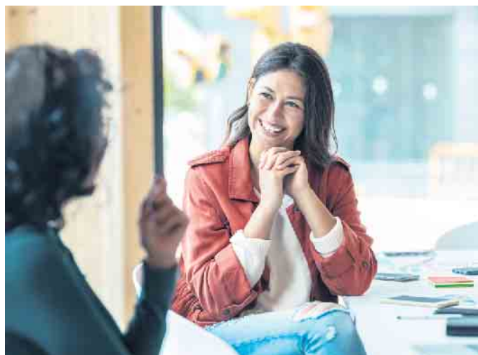
Ein Bewerbungsgespräch ist immer ein Dialog, bei dem auch der Arbeitgeber auf dem Prüfstand steht.

Zuletzt ist der Präsentations-Check für das persönliche oder gegebenenfalls auch virtuelle Bewerbungsgespräch wichtig. Für ein selbstbewusstes Auftreten ist auch hier das Vertrauen in sich selbst und die eigenen Stärken entscheidend. „Einfacher wird es zudem, wenn man sich bewusst macht, dass diese Gespräche keine Einbahnstraße sind“, erklärt GFN-Standortleiterin Michaela Ortega-Dax. „Personalverantwortliche suchen zwar nach passenden Fachkräften. Sie müssen umgekehrt aber auch jeden Bewerber und jede Bewerberin von sich als gutem Arbeitgeber überzeugen.“ (djd)