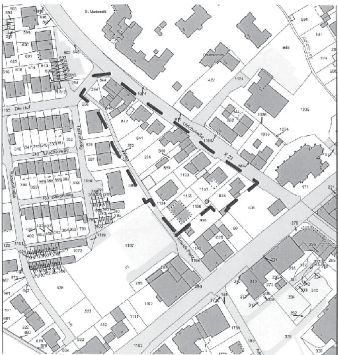
--- Planbereichsgrenze Kartengrundlage: Katasterkarte, unmaßstäblich