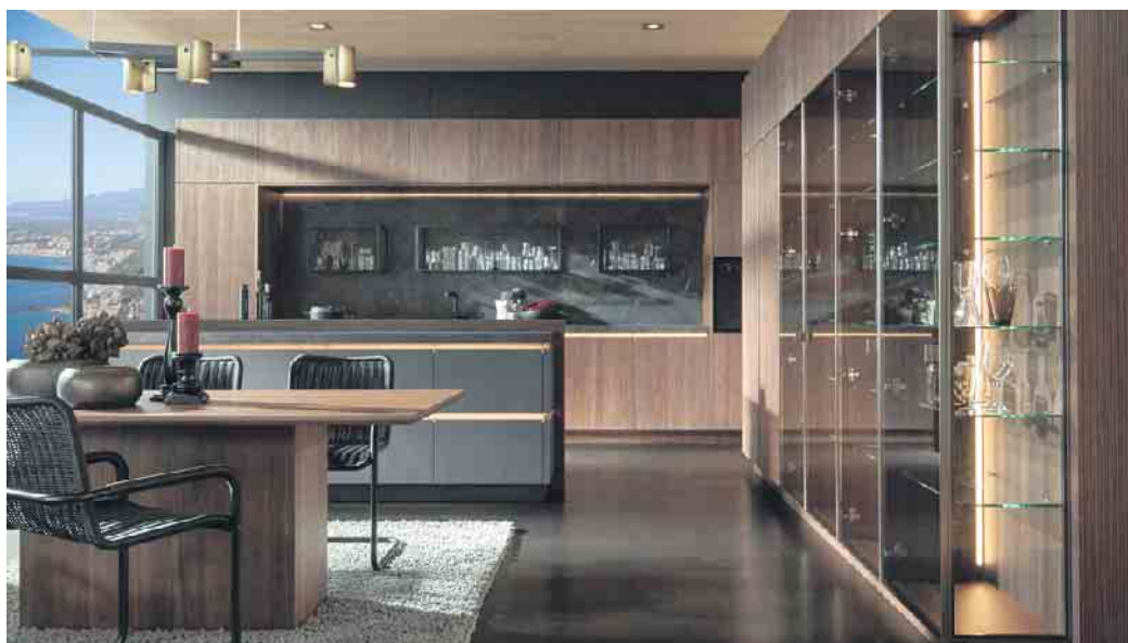
Ein einzigartiges Lichtspiel: Premiumküche mit viel Holz, Glas und gebürstetem Messing, die anhand einer patentierten Beleuchtungslösung perfekt zur Geltung kommen. Ein besonderer Blickfang sind die Vitrinenschränke.

Was es zusätzlich so beliebt in der Küche macht: Glas lässt sich sehr individuell gestalten. Beispielsweise als blickfangende, beleuchtete Nischenrückwand in der persönlichen Lieblingsfarbe, mit einem eigenen Wunschmotiv oder einem der vielen angebotenen Motiv-Dekore. Das kann ein stimmungsvolles Bild aus der Natur sein, ein Appetit Anregendes aus dem Bereich Food oder auch etwas