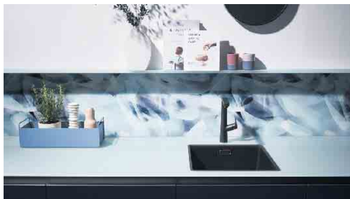
Mit Glas lassen sich sehr individuelle Lifestyles realisieren - beispielsweise diese Komposition in zartem Gletscherblau, bei der das Motiv der Glas-Rückwand ideal mit dem Farbton der Glas-Arbeitsplatte harmoniert.