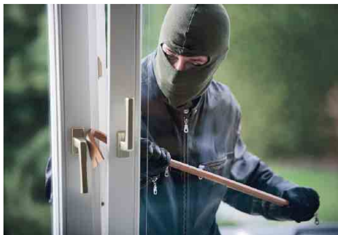
Gekippte Fenster bieten Einbrechern ideale Einstiegshilfen.

ter einzuplanen. Schließzylinder sollten gegen Abbrechen, Herausreißen und Kernziehen geschützt werden. Auch wichtig: den eigenen Haustürschlüssel nie draußen deponieren und die Haustür immer abschließen. Außenbereiche sollten beleuchtet sein, beispielsweise mit Bewegungsmeldern. Und nicht zuletzt sollte man weder auf dem eigenen Anrufbeantworter noch in den sozialen Netzwerken Hinweise auf die geplante Abwesenheit hinterlassen. (akz-o)