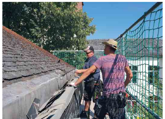
Verklammerung und Befestigung der Dachziegel bzw. -platten werden beim DachCheck geprüft.

Angeschaut werden auch Schneefanggitter und Solaranlagen. Zum Schluss wird ein umfassendes Dach-Check-Protokoll als Inspektionssachnachweis erstellt, das im Falle eines Versicherungsschadens als Vorlage beim Gebäudeversicherer dient. Damit sind Hauseigentümer auf der sicheren Seite. Sollten Schäden gefunden werden, wird der Kunde umfassend informiert und beraten. Unter www.dachcheck.dachdecker.org sind alle wichtigen Informationen für Hauseigentümer zusammengefasst. Auch Dachdeckerbetriebe können über diese Website gefunden werden. (akz-o)