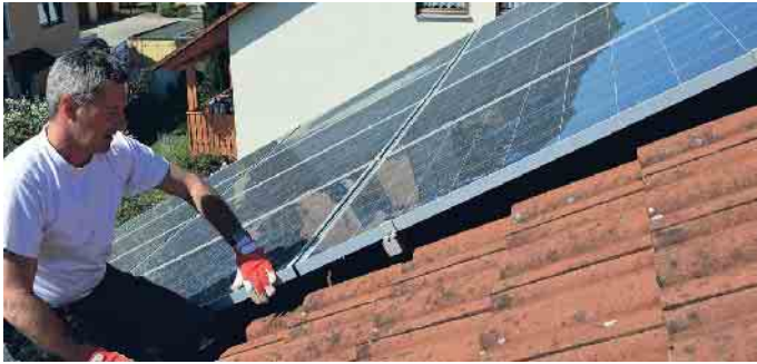
Auch die Begutachtung der Befestigungen von Solaranlagen gehört zum DachCheck.