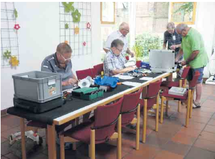
Die Elektriker haben immer gut zu tun.

kennen. Gerne können die Besucher bei der Reparatur helfen. Sollten kleinere Ersatzteile bestellt werden müssen, wird das mit dem Betroffenen besprochen und auf Wunsch direkt vor Ort erledigt. Kaffee und Kuchen stehen nicht nur für Wartende bereit. Auch kann man sich hier zu einem Pläuschchen treffen. Von den Geldspenden geben wir folgende Spenden weiter: Die Katholische Kirche bekommt 100 Euro Heizkosten und 200 Euro für die Jugendarbeit (Messdiener, Kinderchor). Die Flüchtlingskinder in Veen, sowie der Veener Kindergarten bekommen jeweils 200 Euro an Sachspenden. Außerdem wurden wieder zwei Fahrräder fahrtüchtig gemacht und der Alpener Flüchtlingshilfe gespendet. Das Repair-Café finanziert sich über Spenden und findet jeden 1.