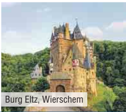
Burg Eltz, Wierschem