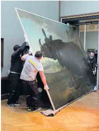
Das Gemälde von Nashorn Clara hängt üblicherweise im Staatlichen Museum Schwerin. Da das Haus wegen Renovierungsarbeiten für drei Jahre geschlossen ist, ging Clara mit großem Aufwand auf Reisen - unter anderem ins berühmte Rijksmuseum nach Amsterdam.

So spannend kann die Tätigkeit beim Kunstspeziallogistiker sein