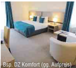
Bsp. DZ Komfort (gg. Aufpreis)