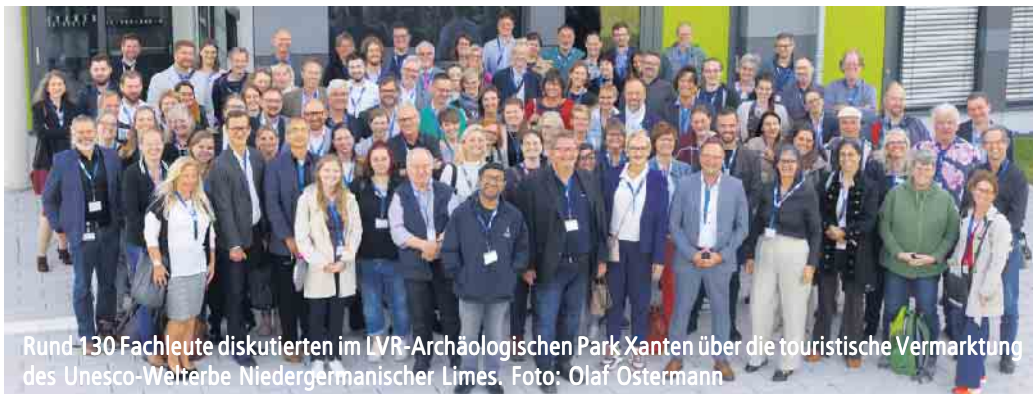
Rund 130 Fachleute diskutierten im LVR-Archäologischen Park Xanten über die touristische Vermarktung des Unesco-Welterbe Niedergermanischer Limes.