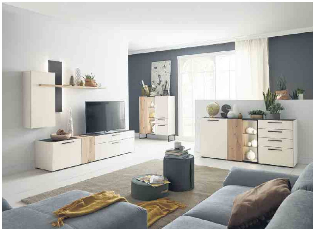
Mit Stauraum allein ist es bei Schränken nicht getan, denn sie sollen dauerhaft schön und sicher sein.

beim Möbelkauf darauf achten, dass der ausgewählte Schrank auch wirklich für seinen angedachten Einsatzort geeignet ist, beziehungsweise dort zum Einsatz kommt, wo der Hersteller ihn vorgesehen hat“, merkt Winning an. Ansonsten könne sich nicht nur die Lebensdauer eines Schrankes verkürzen, sondern auch eine erhöhte Verletzungsgefahr beispielsweise im Kinderzimmer entstehen. Des Weiteren tragen eine angemessene Reinigung und Pflege zur dauerhaft zufriedenstellenden Erscheinung und Nutzung von Möbeln bei. Bei der Auswahl und Gestaltung qualitätsgeprüfter Schränke und Regale gibt es heute (fast) nichts, das es nicht gibt. Neben bewährten Möbeln für alle Wohnbereiche aus Massivholz, Holzwerkstoffen oder anderen Materialien sowie mit furnierter oder folierter Oberfläche sind auch Materialkombinationen und innovative Lösungen beispielsweise mit Anti-Finger- print-Beschichtung möglich. Reichlich oder ganz gezielt Stauraum bieten Fächer und