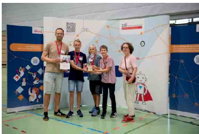
Die glücklichen Sieger des NRW-Finals in der Kategorie Robot-Performance in der Altersklasse weiterführende Schulen - Das Team NextGen-offFood vom Andreas-Vesalius-Gymnasium in Wesel

NRW-Wissenschaftsministerin Ina Brandes gratulierte den Gewinner:innen: „Die Ausbildung junger Menschen zu qualifizierten Fachkräften ist DIE entscheidende Zukunftsfrage, ob wir unseren Wohlstand und unsere soziale Sicherheit werden halten und mehren können. Das gilt ganz besonders für die naturwissenschaftlichen und technischen Berufe. Die zdi-Roboterwettbewerbe sind mehr als eine Spielerei: Sie machen den Fachkräften von