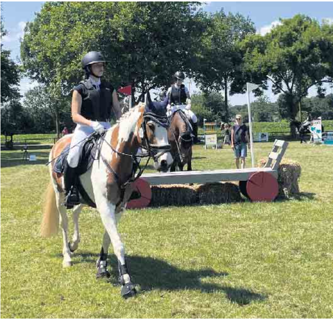
Zeigen der Hindernisse

unterstützen und ihre Wiesen und Wege dem RuFV Rheurdt rund um die Kirchstraße zur Verfügung stellen.