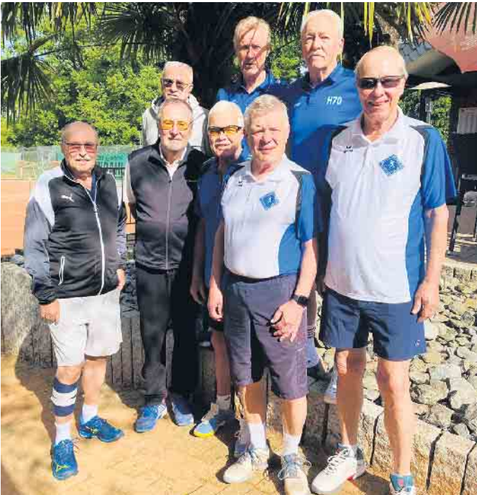
Herren70/75- Aufsteiger 2025