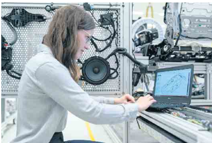
Kupfer spielt in vielen zukunftsweisenden Berufen eine wichtige Rolle - zum Beispiel in der Entwicklung und Produktion von E-Autos.

Zukunftssichere Karrierechancen rund um das vielseitige Metall