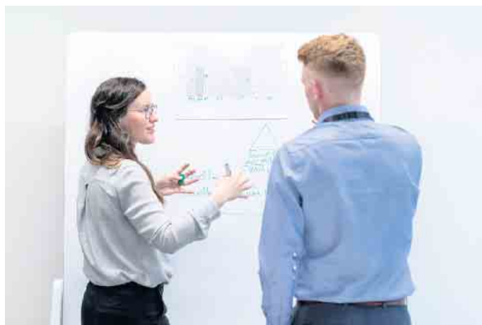
Ingenieure und Forscher arbeiten an zukünftigen Einsatzmöglichkeiten von Kupfer, welche die Energieeffizienz verbessern, mehr Sicherheit schaffen oder neue Kommunikationstechniken unterstützen.

Neben den innovativen Anwendungen in der Energieerzeugung und -verteilung, in der Elektronik und Elektromobilität spielt Kupfer auch in traditionellen Handwerken eine Rolle. Installateure setzen es für Trinkwasser-, Gas- und Heizungsleitungen ein, Elektrohandwerker legen tagtäglich Kupferleitungen. In der Architektur wird das Metall wegen seiner ästhetischen Eigenschaften und Haltbarkeit zum Beispiel für Bedachungen und Fassadenverkleidungen geschätzt. Mu-