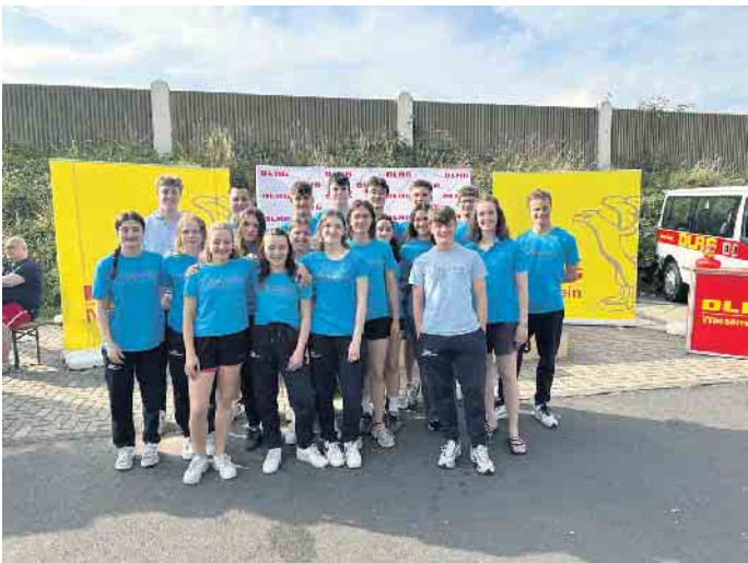
AK 15/16 bis offene Klasse

10. Sie konnte sich den zum ersten Mal ausgetragenen Titel des Landesmeisters sichern. Die weiteren Medaillenplätze: Silber für die AK 12 m und 15/16 m, sowie Bronze für die AK 15/16 w. Die AK Offen w + m verpassten mit ihrem jeweiligen 4. Platz nur knapp das Treppchen. Ein besonderer Dank gilt unseren Trainern und vier Kampfrichtern, die in der Halle im Einsatz waren. Ebenso bedanken wir uns herzlich bei den vielen Eltern, die als Fahrer, Zuschauer und Unterstützer dafür sorgten, dass das Rheurdt Team bestens begleitet wurde.