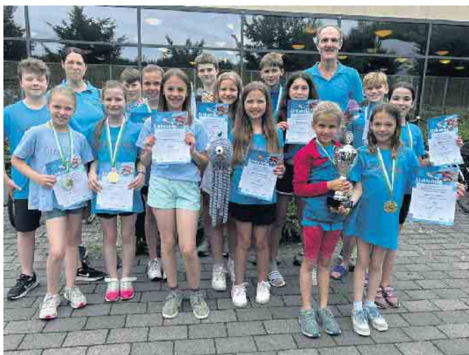
AK 10 und 12

Rheurder Schwimmer überzeugen mit starken Leistungen