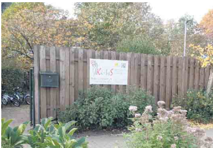
Ki-IsS Familienzentrum - St. Nikolaus Kindergarten

Entspanntes Schlafen für Babys und Eltern? Das Thema Schlaf bewegt viele junge Eltern und ist lange Zeit so präsent wie kaum ein zweites. Welche Erwartungen haben wir Erwachsenen rund um den Kinderschlaf und welche Voraussetzungen bringt kindlicher Schlaf von Natur aus mit sich? Wie kann ich meinem Baby helfen, besser ein- und durchzuschlafen und wie kann ich Bedingungen schaffen, dass alle Familienmitglieder ruhigere Nächte haben?