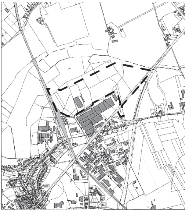
---- Planbereichsgrenze Kartengrundlage: Katasterkarte, unausföhrlich