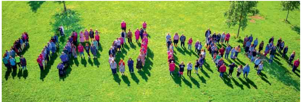
Bei einer Fotoaktion haben über 100 Frauen das Wort LIPÖDEM gebildet.

In Moers gibt es bereits seit 2022 eine Selbsthilfegruppe für Frauen mit Lipödem. Nun sucht die Gruppe gezielt nach neuen Mitgliederinnen, die sich austauschen, gegenseitig unterstützen und Kraft schöpfen möchten. Willkommen, sind alle Frauen, die direkt oder indirekt mit der Erkrankung zu tun haben - unabhängig vom Stadium oder bisherigen Erfahrungen.