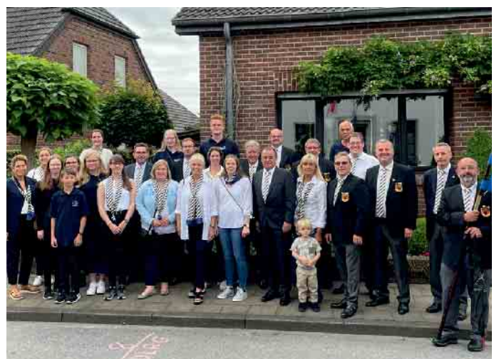
Kirmes Sevelen 2022