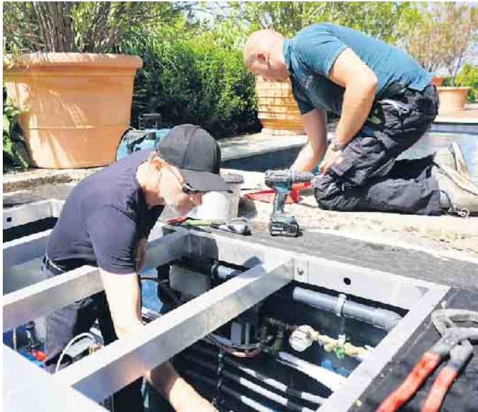
Arbeiten am Technischacht.

Da das Privatvermögen der Deutschen einen Stand von rund 7 Billionen Euro erreicht hat und es hierzulande rund 18 Millionen Einfamilienhäuser, aber nur 2,1 Millionen private Pools gibt, ist Marktpotenzial vorhanden. Jobangebote aus der Schwimmbadbranche findet man auf der Website des Bundesverbandes Schwimmbad & Wellness e.V. (bsw) unter www.bsw-web.de . (akz-o)