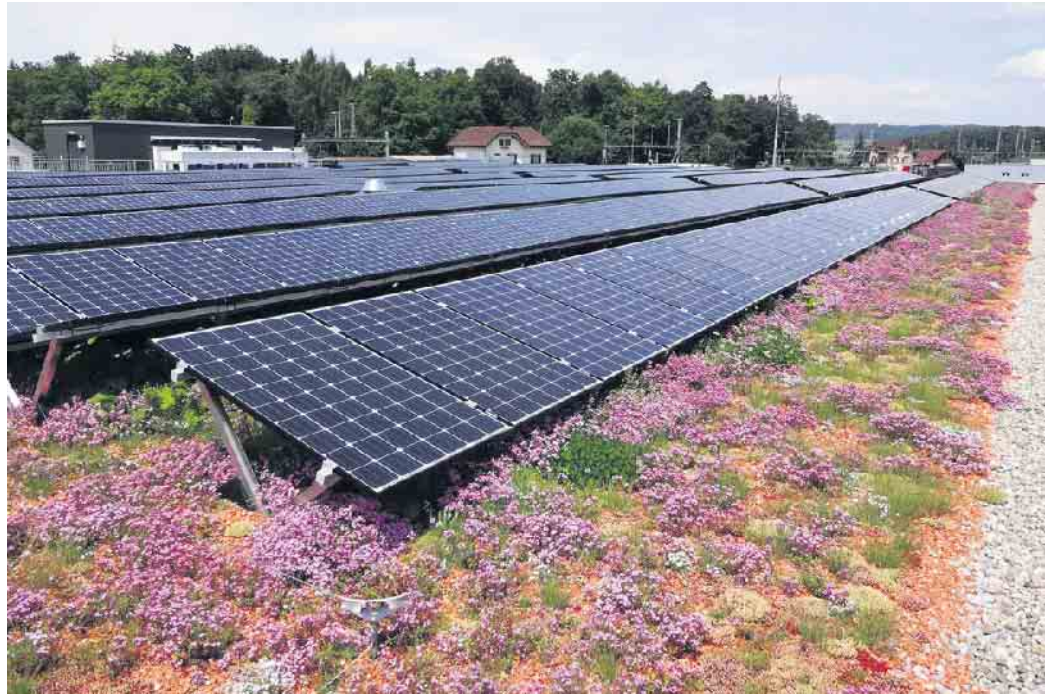
Solare Technik und eine Dachbegrünung: Diese Kombination ist gleichermaßen ökologisch als auch wirtschaftlich sinnvoll.

Bei der Dachbegrünung lassen sich grundsätzlich zwei Konzepte unterscheiden. Während die naturnahe extensive Nutzung auf pflegeleichte und trockenheitsangepasste Pflanzen setzt, die sich weitestgehend selbst erhalten, ähnelt die intensive Gestaltung einer Gartenanlage. Dabei werden gezielt Rasenflächen, Stauden, Gehölze und Bäume ge-