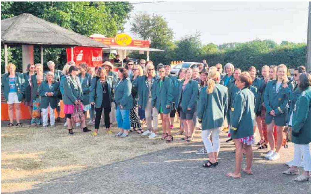
50 Powerfrauen bei der Dorfweite

Krönungsball mit den geladenen Gastvereinen sowie der Schützenfamilie und der Dorfgemeinschaft. Für die Schützenbrüder findet das Antreten um 16 Uhr in der Allee statt. Um 17.15 Uhr werden Parade und Fahنشwenken durchgeführt. Und für 17.30 Uhr ist die lokale Presse zum Fototermin eingeladen. Mit herzlichem Schützengruß, Johannes Heilen 2. Brudermeister