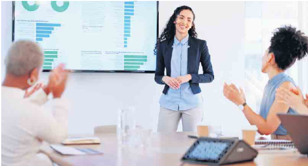
Lampenfieber ade: Wie man erfolgreich PowerPoint-Präsentationen erstellt und vorträgt, lässt sich mithilfe einer Weiterbildung schnell erlernen.

Arbeitnehmerinnen und Arbeitnehmer sollten und müssen deshalb fundierte Kenntnisse in diesen Software-Anwendungen besitzen. Viele Bewerber - einige Studien gehen von bis zu 75 Prozent aus - „dehnen“ allerdings die Wahrheit, um einen besseren Eindruck zu hinterlassen. Die übertriebene Darstellung eigener Word- oder Excel-Kenntnisse mag wie eine erfolgversprechende Strategie aussehen - sie rückt den