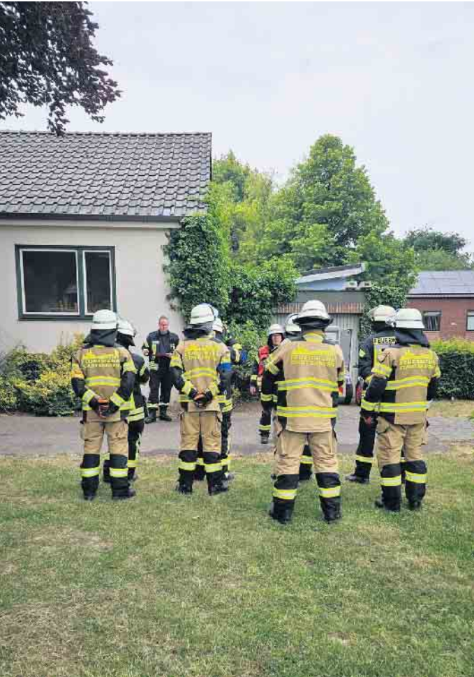
Grundlehrgang der Feuerwehren Xanten, Sonsbeck und Alpen in Hamb