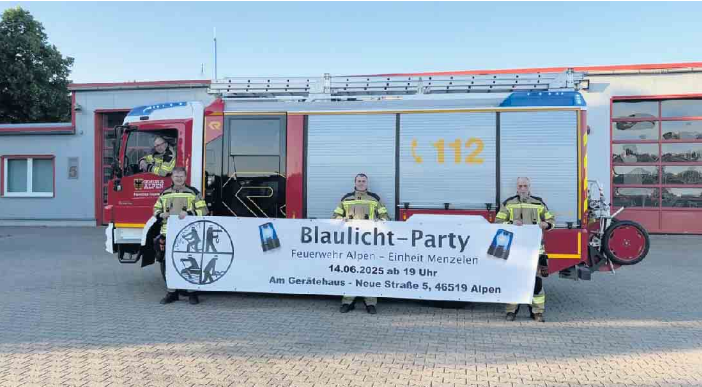
Blaulichtparty Vol. 5, FFA Menzelen