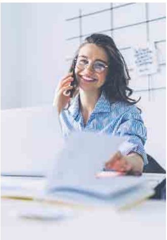
Echter Durchblick statt Chaos: Schulungen in MS Office sind ideal für alle, die sich auf Bürojobs bewerben wollen.

hört als der Satz „Da bin ich Profi“, der sich im Arbeitsalltag dann als falsch herausstellt. Hier gilt das Motto: Mut und Offenheit zur Wissenslücke - oder besser noch im Vorfeld Lücken schließen. (DJD)