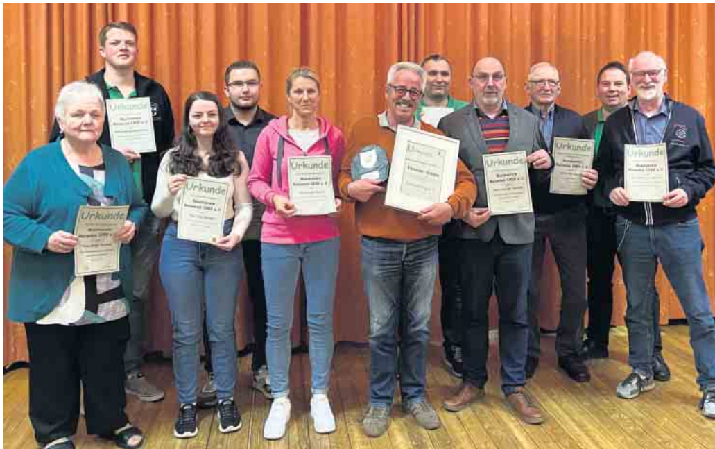
Jubilare des letzten Geschäftsjahres.

Im April dieses Jahres fand die Jahreshauptversammlung des Musikverein Menzelen im Probelokal des Vereins statt, zu der alle aktiven und passiven Mitglieder eingeladen wurden.