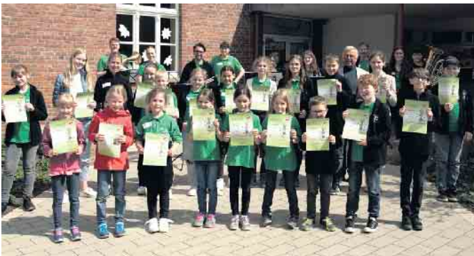
Teilnehmer und Helfer der Musikolympiade.

den schließlich zehn Disziplinen ausgewählt: Zum Beispiel mussten sie die Tonhöhe erkennen oder einen Notenschlüssel zeichnen. Außerdem sollten sie einen bestimmten Rhythmus klatschen, was allen sehr leichtfiel. Nach der Musikolympiade war noch genug Zeit um sich auf dem Schulhof der Grundschule Menzelen mit Fangen oder Fußballspielen auszutoben oder sich am Kuchenbuffet zu stärken. Vor der Verleihung der Urkunden lieferten die Prüfer und die Blockflöten-Kinder noch ein kleines Konzert für alle Teilnehmer. Danach wurden unter Anwesenheit der Eltern die Urkunden an die Kinder verliehen, diese kennzeichneten den guten Erfolg der Teilnehmer. Zu den Urkunden konnten sich die Kinder außerdem einen Preis aus-