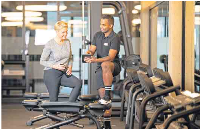
Wer trainiert, möchte dabei gut betreut sein: Fachkräften bieten sich in der Fitness- und Gesundheitsbranche sehr gute berufliche Perspektiven.

Wegen der großen Nachfrage nach Fitness- und Gesundheitstraining muss eine bedarfsgerechte und fundierte Betreuung aller Mitglieder, die in Fitness- und Gesundheitsanlagen trainieren, sichergestellt sein. Entsprechend groß ist das Potenzial für gut ausgebildete Fachkräfte. Qualifizieren können sich künfti-