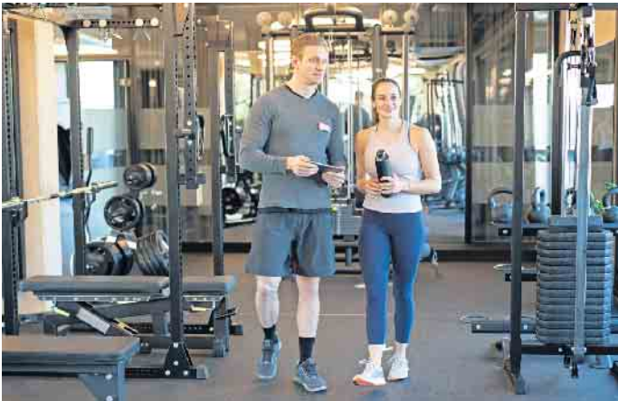
Fitness- und Gesundheitsanlagen etablieren sich zunehmend als elementare Bestandteile der Gesundheitsversorgung.

Studium/Ausbildung: Gute Perspektiven in der Fitness- und Gesundheitsbranche