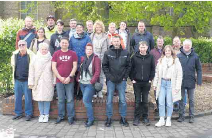
Besuchergruppe mit der St. Nikolaus Kirche im Hintergrund

Alpen. Eine Besprechung mit dem Vorstand ihres Fördervereins führte den Leitungs- und Mitarbeiterkreis des Pfadfinderstammes St. Ulrich jüngst nach Veen. Der muntere Aus-