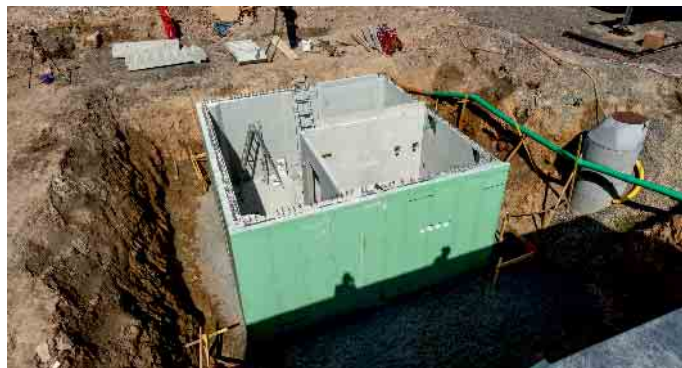
6,50 mal 6,50 Meter Baugrube reichen für einen kompakten Teilkeller meist schon aus.

Ein weiterer Vorteil: Teilkeller sind mehr oder weniger flexibel unter dem Haus platzierbar. Eine praxistaugliche Anbindung ans Versorgungsnetz des Hauses sowie eine hinreichende Be- und Entlüftung sind allerdings zu beachten. Praktischerweise schließt zudem die Kellertreppe an die Erdgeschossstreppe an. „Die Kellerexperten arbeiten im Zuge der individuellen Planung verschiedene Möglichkeiten aus“, sagt der GÜF-Vorsitzende und schließt: „Die Haustechnik ist nirgends besser aufgehoben als unter dem Erdgeschoss. Wer sich also gegen eine Vollunterkellerung entscheidet, sollte wenigstens einen kleinen Keller einplanen statt gar keinen Keller.“ GÜF/FT