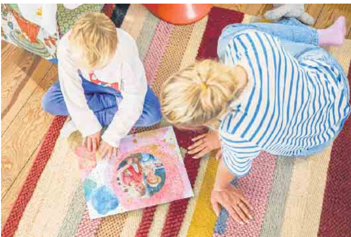
Ein selbst gestaltetes Fotopuzzle sorgt für gute Laune - nicht nur zu Ostern.