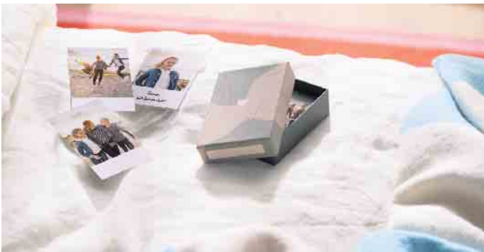
Sogenannte Little Prints halten besondere Momente im handlichen Format fest.