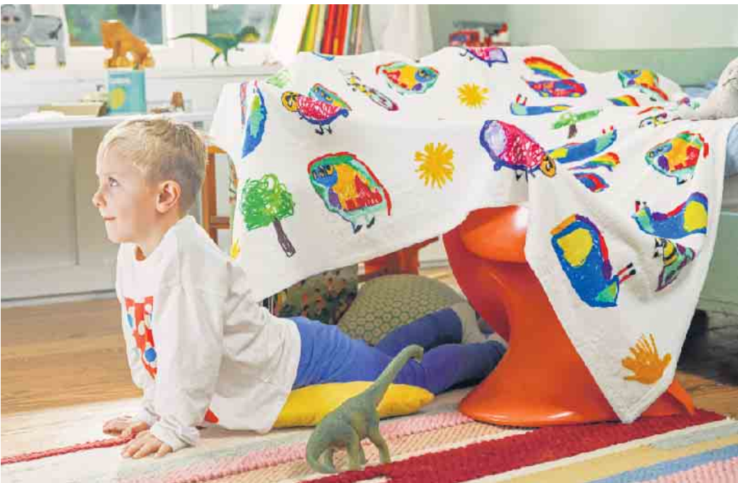
Diese Kuscheldecke gibt es nur einmal: Kinderzeichnungen sorgen für einen unverwechselbaren Look und machen aus dem Osterpräsent ein Unikat.

An kühlen Frühlingsabenden spendet eine Kuscheldecke wohlige Wärme oder dient Kindern zum Bauen einer gemütlichen Höhle. Noch mehr positive Emotionen weckt das Lieblingsstück, wenn es mit einer fröhlichen Kinderzeichnung bedruckt wurde. Die Fleecedecke lässt sich vollflächig gestalten und ist etwa bei Cewe in drei Größen als originelles Osterpräsent erhältlich. Dazu einfach das Bild der Wahl einscannen und hochladen. Auf dieselbe Weise lässt sich auch ein Emaille-Becher im stylischen Vintage-Look in ein Unikat verwandeln. Zudem bietet das lange Osterwochenende endlich wieder Zeit zum Spielen im Familienkreis. Kleine