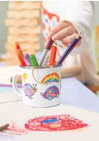
Eine Zeichnung der Kids schmückt den neuen Lieblingsbecher aus Emaille.

Doch nicht nur die Kids, sondern auch Erwachsene freuen sich über gelungene Überraschungen im Osternest. Ein Foto-Schlüsselanhängen mit einem Schnappschuss der Familie begleitet die beschenkte Person über lange Zeit. Auch sogenannte Little Prints lassen sich kreativ gestalten. Bis zu vier Herzensmomente finden Platz auf einem Foto-Magnetstreifen. Das Präsent haftet auf allen magnetischen Oberflächen und kann somit von der Kühlschranktür bis zum Schlüsselboard überall im Haushalt dekoriert werden. Noch ein Tipp: Ein guter Tropfen ist als Mitbringsel zum Osterbrunch immer eine gute Idee. Wer vorher zum Beispiel unter www.cewe.de ein Foto-Etikett mit persönlichen Motiven entwirft, macht aus jeder Flasche ein Einzelstück und schafft somit besondere Genussmomente. (DJD)