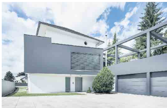
Die Fassade hat nicht nur eine schützende Funktion - sie bildet gleichzeitig das Gesicht des Eigenheims.

Neben Farbe und Putz spielt Klinker eine große Rolle. Häuser mit Klinkerriemchen prägen das Straßenbild ganzer Regionen beispielsweise im Norden und Westen Deutschlands. Das klassische Material wird heute mit einer noch größeren Vielfalt an Farben und Formaten wiederentdeckt. Die moderne Klinkerfassade erlaubt besondere Gestaltungen, gerade im Rahmen der Fassadendämmung. Die Basis dafür bildet stets ein Naturmaterial: Lehm, der entweder zu Klinkern gepresst oder zu Ziegeln geformt und anschließend gebrannt wird. (djd)