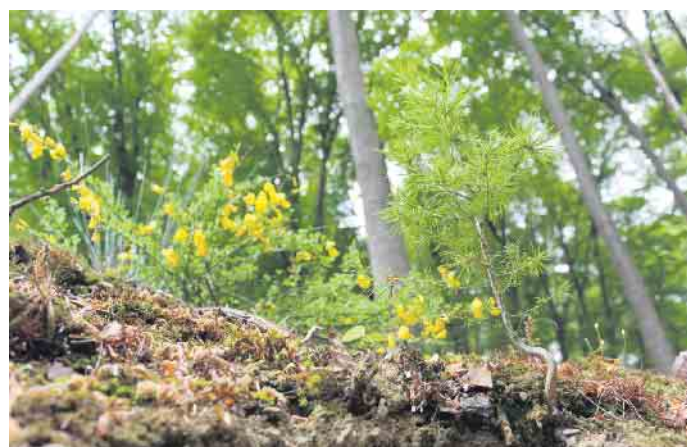
Nachwachsender und klimafreundlicher Rohstoff: Holz speichert während seines Wachstums große Mengen an Kohlendioxid.

Unter www.holzvomfach.de gibt es dazu mehr Informationen sowie weitere Tipps zum nachhaltigen und klimaschonenden Bauen. (djd)