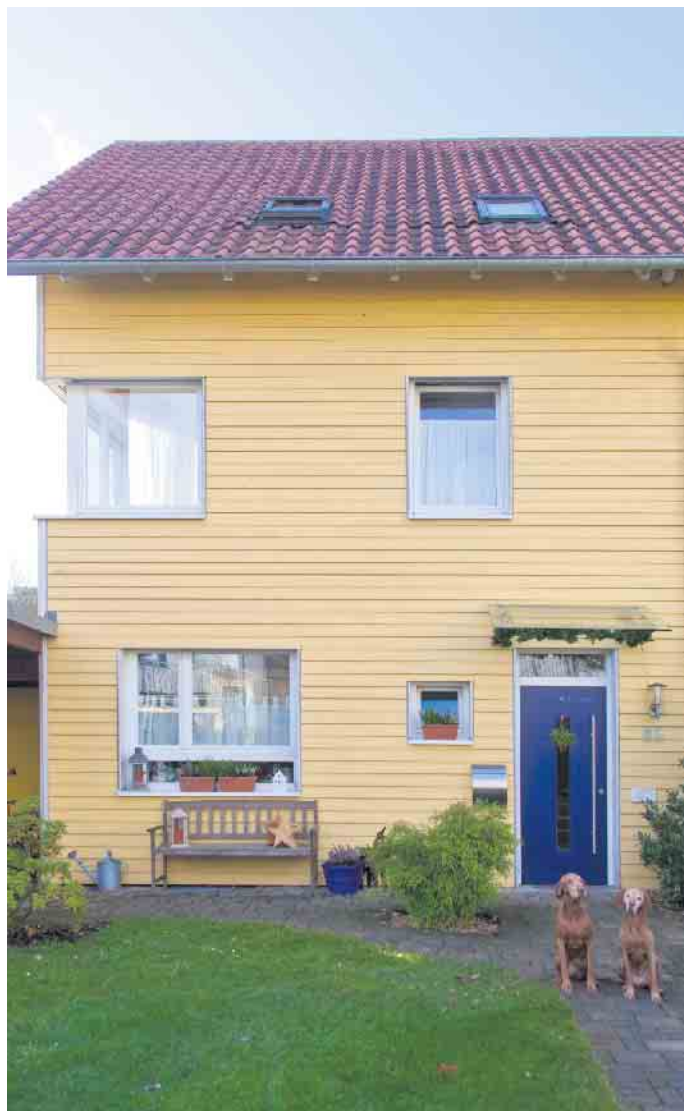
Holzfassaden vermitteln Behaglichkeit und fördern ein gesundes Raumklima.

Ökologie und Vielseitigkeit sprechen für den nachwachsenden Rohstoff