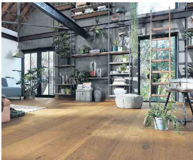
Kleine Kerben oder Dellen können mit speziellen Hartwachsen ausgebessert werden.

Bevor es an die Pflege geht, muss der Schmutz runter. Mit einem Besen aus weichen Borsten oder einem Staubsauger mit weichem Parkett-Aufsatz werden Staub, Schmutz und grobe Partikel entfernt. So wie bei Massivholzmöbeln sollte auch die Parkettoberfläche anschließend mit einem nebelfeuchten Mopp gewischt werden. „Beim feuchten Wischen gilt es, immer ein zur Oberfläche passendes Reinigungsmittel zu verwenden. Zum Beispiel darf geöltes Parkett nicht mit einem Mittel für lackierten Boden gereinigt werden“, sagt der Experte. Ebenfalls sollten keine universellen Allzweckreiniger eingesetzt werden. „Diese könnten die Oberfläche sogar beschädigen,