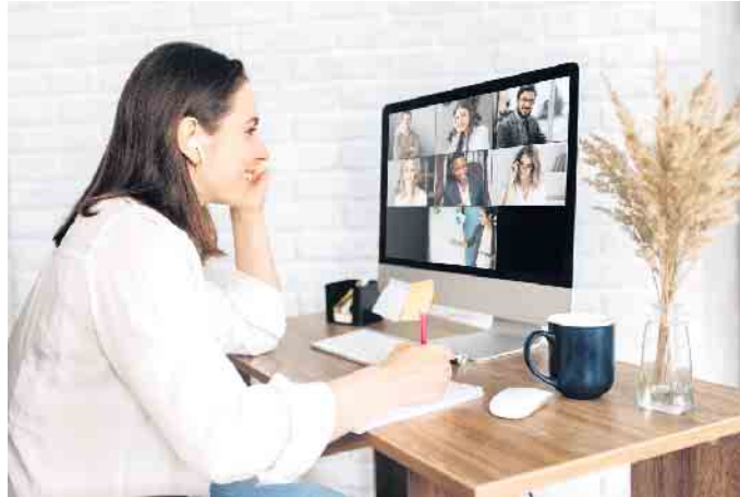
Von zu Hause aus, aber trotzdem mit einer Gruppe lernen: Das ist möglich auf einem Online-Campus.

Nachwuchskräfte fehlen in vielen Branchen an allen Ecken und Enden: Bei der Konjunkturumfrage 2022 der Deutschen Industrie- und Handelskammer (DIHK) sahen 56 Prozent der rund 24.000 befragten Unternehmen den Fachkräftemangel als eines der größten Geschäftsrisiken der Zukunft an. Eine mögliche Lösung kann es sein, junge Menschen in der eigenen Firma passend auszubilden. Wer als Ausbilder oder Ausbilderin in einem Unternehmen arbeiten will, muss allerdings vorab eine erfolgreiche Prüfung dafür ablegen. Das entsprechende Fachwissen kann in einem Vorbereitungslehrgang erworben werden und einen solchen gibt es auch als reine Online-Variante.