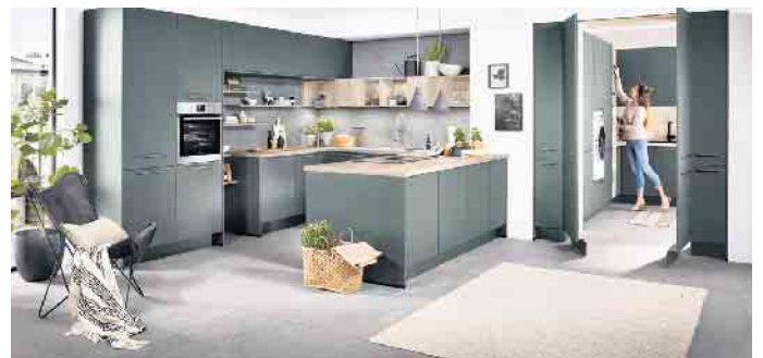
Neue Möglichkeiten bei der Raumplanung: Einladende U-förmig angeordnete Wohnküche mit einer praktischen Durchgangstür in Schrankoptik, durch die man in den angeschlossenen und diskret verborgenen Hauswirtschaftsraum gelangt - das Ganze in Kombination mit zwei Hochschränken.

Schiebetür- bzw. Gleittürsysteme bieten interessante Alternativen. Beim Öffnen verschwinden sie entweder