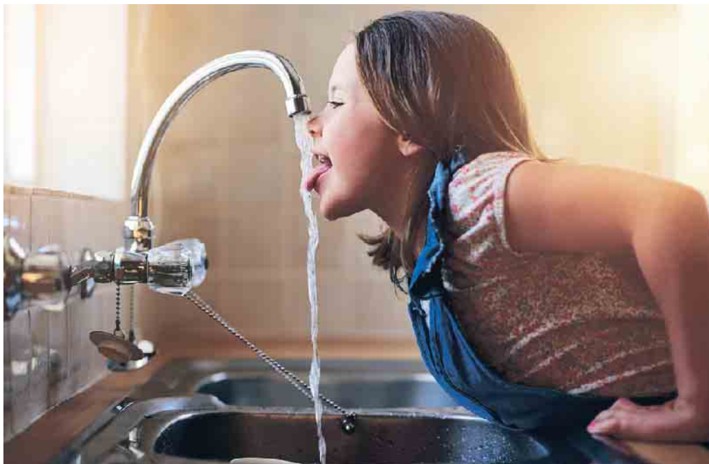
Wie selbstverständlich läuft bei uns das Wasser aus dem Hahn. Doch angesichts der Klimaveränderungen wird es nicht ewig so weitergehen.

Ein großer Vorteil von Regenwasser ist dessen gute Grund-