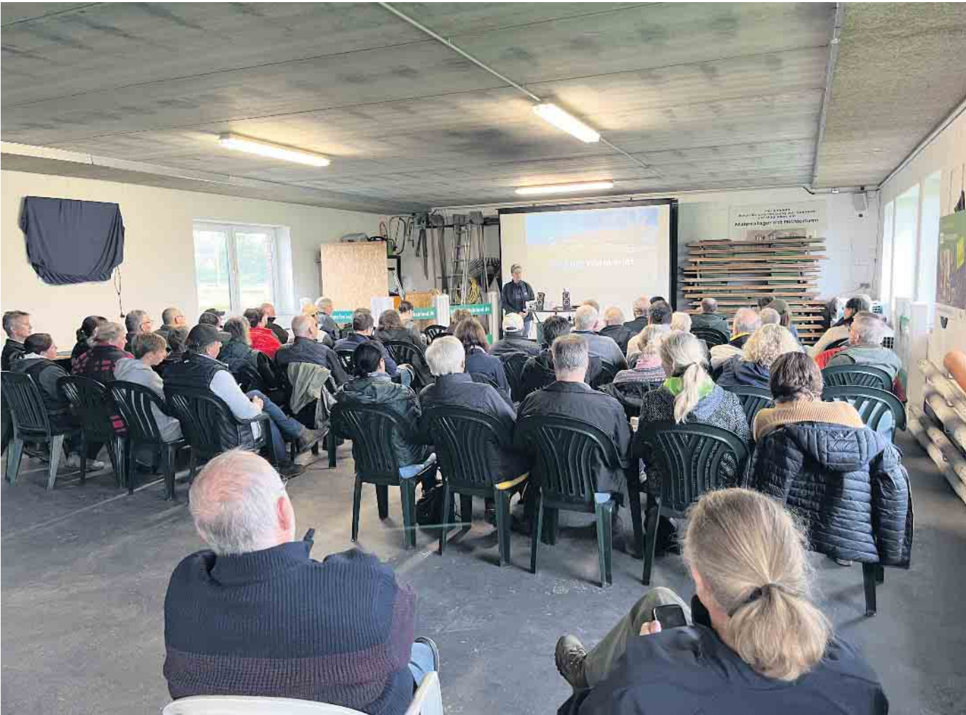
Fahrer für Pferdefreunde im Richterhaus an der Kirchstraße in Rheurdt

Im Rheinland etabliert sich die Fortbildungsveranstaltung „Fahrer für Pferdefreunde“. Bereits zum dritten Mal fand am letzten Sonntag im Oktober diese Veranstaltung im Landesstützpunkt FAHREN in Rheurdt statt. Nicht ausschließlich für Fahrer, sondern für alle Pferdesportler ging es hier unter anderem um die Themen „Entwurmung“ und „Nachwuchsförderung“. Ein gemeinsames Mittagessen und der Austausch untereinander rundeten den Tag im Richterhaus des Reit- und Fahrvereins Rheurdt ab.