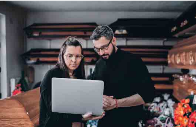
Alles digital bei der Bestattungsplanung? Wie helfen digitale Services bei einer Bestattung - und wann ist der Mensch das bessere Gegenüber?

67 Millionen Menschen sind in Deutschland täglich online und suchen als Erstes im Internet nach Hilfe und Antworten, sogar bei einer Bestattung. Auf welche digitalen Services Sie vertrauen können und wann Sie lieber auf ein persönliches Gegenüber vertrauen sollten, erfahren Sie hier.