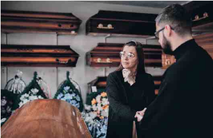
Persönliche Unterstützung im Trauerfall.

Die ausschließliche Nutzung digitaler Technologien kann zu einer Entfremdung von der eigentlichen Trauer führen. Wenn Menschen sich nur auf Online-Plattformen oder soziale Medien für Kondolenzbekundungen und Erinnerungen verlassen, können persönliche Kontakte vernachlässigt werden oder man gerät in eine endlose digitale Trauerschleife. Trost und direkte menschliche Unterstützung lassen sich nicht vollständig digital ersetzen.