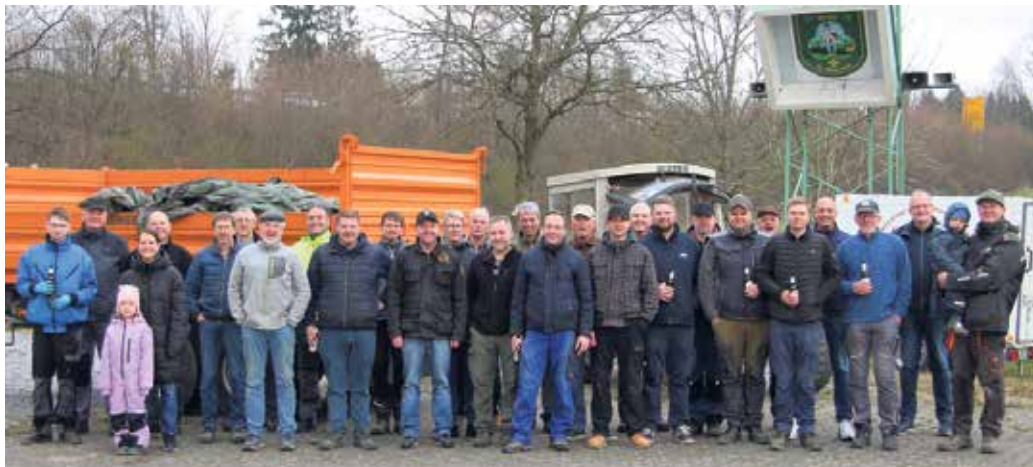
Die Helferinnen und Helfer bei der Dorfreinigung in Buke

Jährliche Dorfreinigung der Schützenbruderschaft Buke