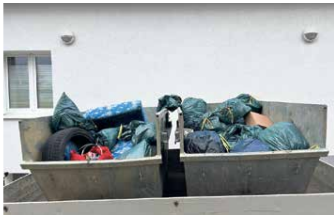
Was zusammenkommt, wenn viele Hände anpacken

Besonders erfreulich war der Zusammenhalt während der Aktion: Jung und Alt packten gemeinsam an, tauschten sich aus und sorgten dafür, dass nahezu kein Bereich des Ortes unbeachtet blieb. Der Frühjahrsputz zeigt einmal mehr, wie wichtig gemeinsames Handeln für ein gepflegtes Ortsbild ist. Zum Abschluss trafen sich alle Beteiligten am Pfarrheim in Altenbeken. Bei einem gemeinsamen Grillen wur-