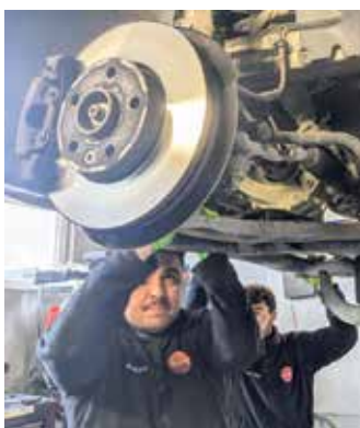
In der neuen Werkstatt in Buke wird es künftig vier Hebebühnen geben, statt nur einer.

wichtiger Treffpunkt mit Kaffeeangebot und Paketshop", betont Yüzgec. Die AVIA-Tankstelle an der Paderborner Straße 28 ist montags bis freitags von 6:30 bis 18:30 Uhr sowie samstags von 8:00 bis 14:30 Uhr geöffnet. Die Werkstatt arbeitet werktags von 8:00 bis 17:00 Uhr sowie samstags von 8:00 bis 12:00 Uhr.