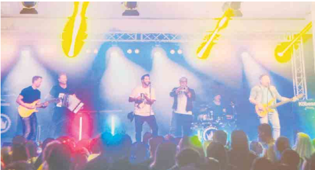
„Die Köbesse“

Die „Köbesse“ haben es auch bis nach Amerika geschafft. Als erste deutsche Band spielten sie in New York bei der German-American Steuben Parade im Jahre 2022. „Unbezahlbar sind aber die Momente, in denen du in das