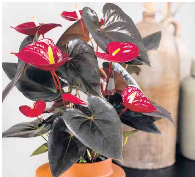
Ausreichend Licht und im Idealfall 18 bis 25 Grad Celsius, dann fühlen sich die Anthurien im Topf rundum wohl.

Anthurien haben als Zimmerpflanzen keine Blühsaison. Sie zeigen ihre Hochblätter bei guter Pflege und richtigem Standort mehrere Monate lang und entwickeln immer wieder neue. Doch gerade während der Winterzeit bilden sie häufig weniger Hochblätter oder legen gar eine Blühpause ein. Der Grund: Lichtmangel und zu niedrige Temperaturen!