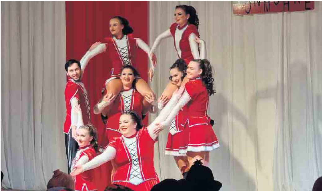
Mittlere und große Garde der Tonmöhne.

In der Mitte des Abends begeisterte die Band Miljö die Gäste. Die Tonmöhne freuen sich auf den 31. Januar, wenn es wieder heißt: „Schlager trifft Karneval“. (SAPIR)