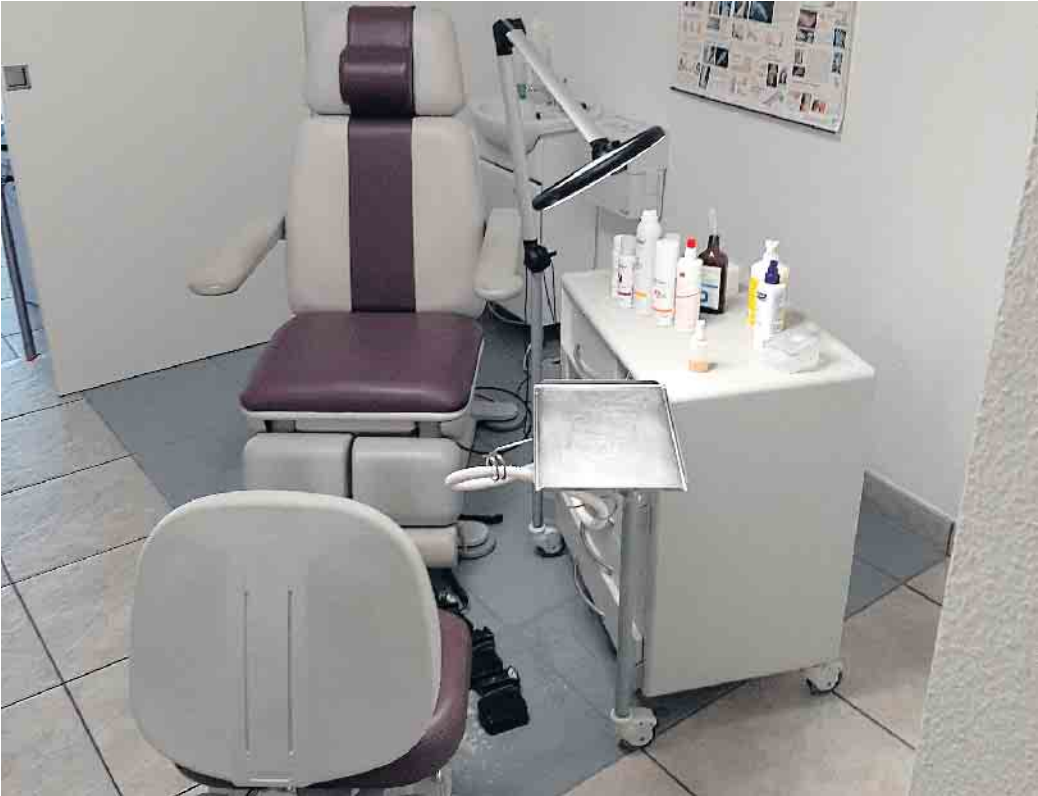
Neben medizinischer Podologie bietet das Kosmetikinstitut Lütz pflegende und dekorative Kosmetik sowie moderne Nagelkosmetik.