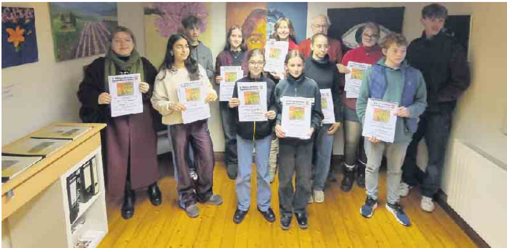
Die teilnehmenden Schüler.

Collage aus Blättern und blauem Müll gewinnt 8. Witterschlicker Jugendkunstpreis