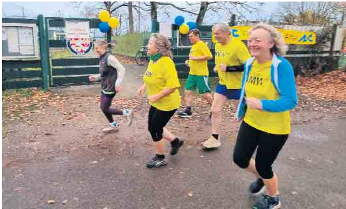
Freuen sich aufs Laufen