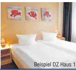
Beispiel DZ Haus 1