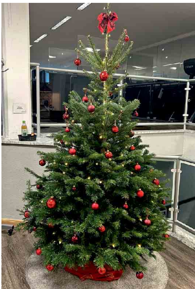
Der Tannenbaum im Aktivo - Training und Reha