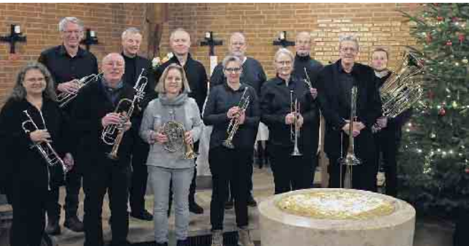
Mitglieder der Greenhorns.

Feststimmung am 4. Advent in Witterschlick