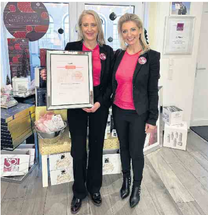
Gratulation der Fa. KLAPP Cosmetics zum Jubiläum

All dies Mühen wären allerdings umsonst ohne das Wichtigste, das eine erfolgreiche Arbeit ausmacht: den treuen, teilweise jahrzehntelangen Kunden. Viele von ihnen waren an diesem Tag anwesend. Und im Gespräch mit den Damen wurde deutlich: die Wertschätzung der Kundinnen beruht nicht nur auf der fachlichen Kompetenz.