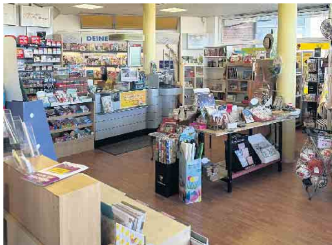
Schreibwarenladen von innen