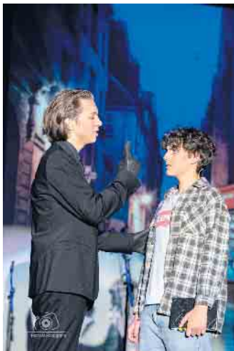
Chasing Shadow - Rhein-Sieg-Gymnasium

Junge Theatergemeinde BONN möchte Kinder und Jugendliche dazu ermutigen, diese einmalige Chance wahrzunehmen, auf einer „echten“ Bühne mit professioneller Unterstützung durch die Fachleute der Bühnen-, Ton- und Lichttechnik aufzutreten und ihr Können, ihre Phantasie und ihre Kreativität mit anderen zu teilen. Weitere Informationen zum Festival, zur Jury und zu zusätzlichen Angeboten für Gruppen sowie die ausführliche Ausschreibung und Bewerbungsformulare gibt es hier: www.spotlights-bonn.de Für Fragen und weitere Informationen steht das Jugendreferat der Theatergemeinde BONN zur Verfügung: jtg@tg-bonn.de oder Tel. 0228/91 50 30