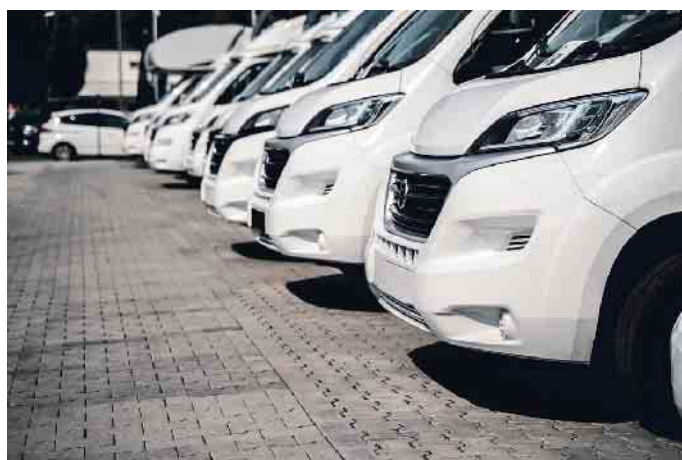
Wohnwagen sind aktuell sehr beliebt.

Unabhängig vom Fahrzeugtyp sollten Mietinteressenten genug Zeit für ihren Urlaub einplanen. Denn unter einer Woche vermieten die wenigsten Händler ihre Fahrzeuge. Das hat aber einen guten Grund, über den sich Kunden freuen können: In den vergangenen zwei Jahren sind die Hygienestandards nochmal gestiegen. Innenräume werden zusätzlich zur