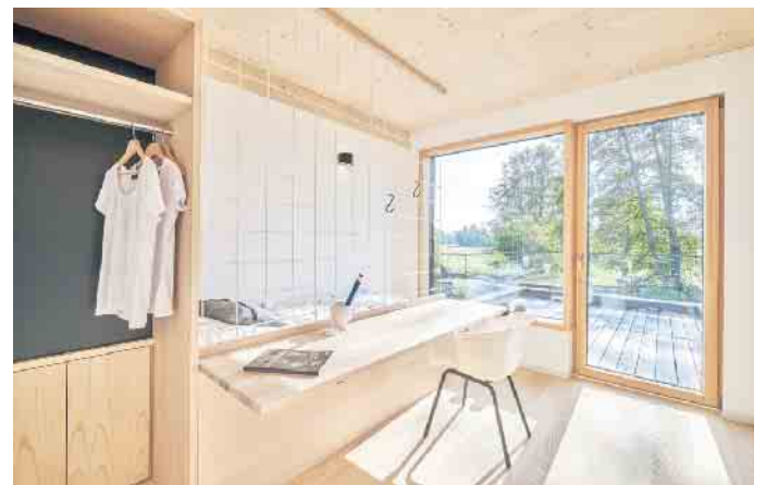
Offene Grundrisse und viel Tageslicht lassen auch kleine Wohnflächen großzügig wirken – funktional geplant entsteht hoher Komfort auf kompaktem Raum.

Auf kleiner Fläche lässt sich hoher Wohnkomfort und ansprechendes Design verwirklichen. Mit modernen Fensterlösungen und hochwertigen Materialien stehen kleine Häuser den großen Varianten in nichts nach. Große Verglasungen bringen Licht ins Innere