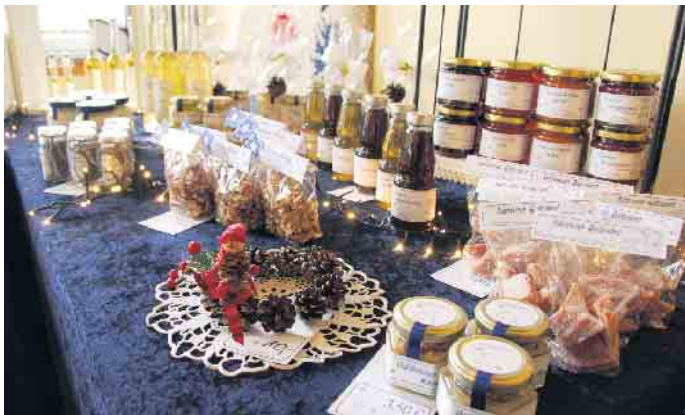
Imkereiprodukte aus eigener Herstellung