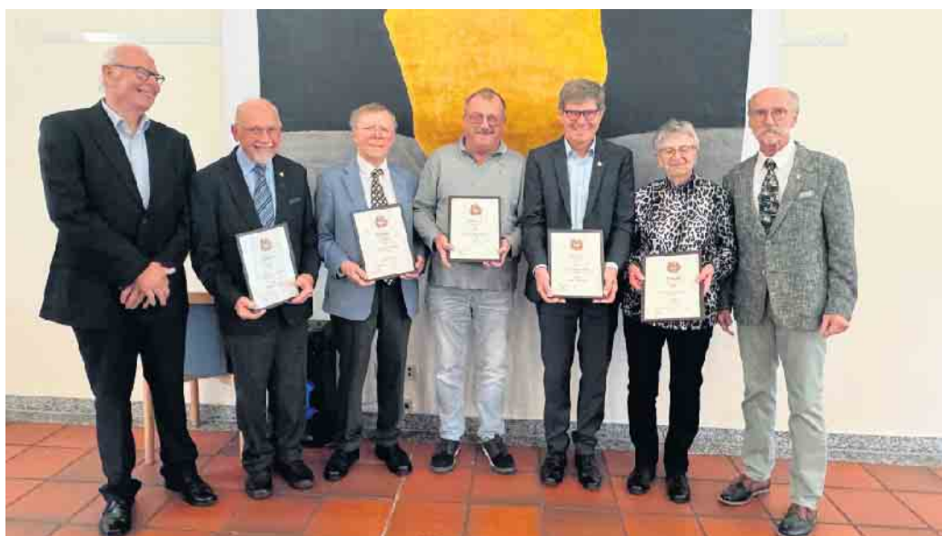
Die Jubilare.