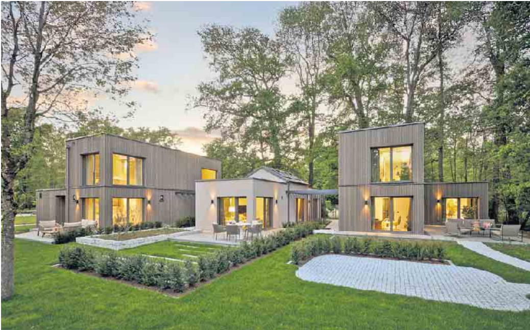
Kleine Fertighäuser überzeugen mit klarer Architektur, effizienter Bauweise und einer ansprechenden Optik.

Flexibilität und Zukunftsfähigkeit Auch ein kleines Fertighaus kann sich langfristig an wechselnde Lebensumstände anpassen. Denn Barrierefreiheit und ein altersgerechter Umbau lassen sich sinnvoll umsetzen. Bei kleinen Grundrissen ist es entscheidend, die spätere Nutzbarkeit von Anfang an mitzudenken: flexible Raumaufteilungen, kurze Wege, gute Zugänglichkeit. Werden diese Aspekte berücksichtigt, wird auch ein kleines Haus ein Zuhause, das mitwächst. Kompakt Wohnen bedeutet keinen Verzicht, sondern es bietet