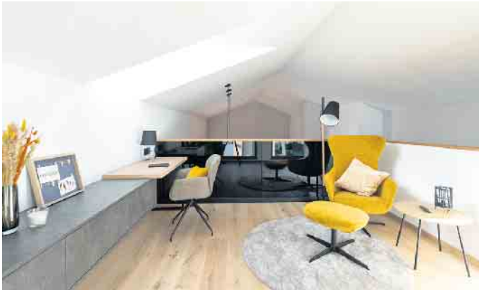
Ein multifunktionaler Arbeits- und Rückzugsort bietet sich etwa auf einer Galerie über dem offenen Küchen-, Ess- und Wohnbereich.