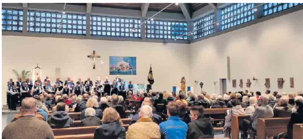
MGV „Rheingold“ in der Kirche St. Lambertus.