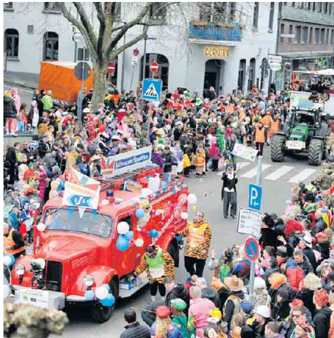
Karnevalszug in Witterschlick

Wer bislang noch nicht im Witterschlicker Zug mitgezogen ist, kann sich vorab per E-Mail unter info@oa-witterschlick.de mit seiner E-Mail-Adresse anmelden. Der Ortsausschuss freut sich schon jetzt auf viele kreative Ideen, bunte Kostüme und ein stimmungsvolles „Witterschlick Alaaf!“ am Karnevalssonntag 2026.