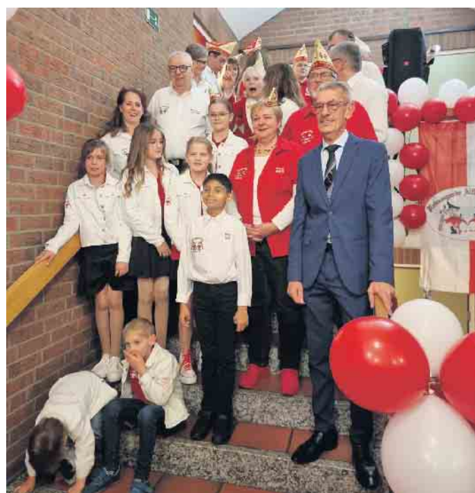
Prinzenpaar und Kinderdreigestirn mit ihren Adjutanten

Nach dem offiziellen Teil begann der „Partyteil“, der noch bis in den frühen Morgen ging. (SAPIR)