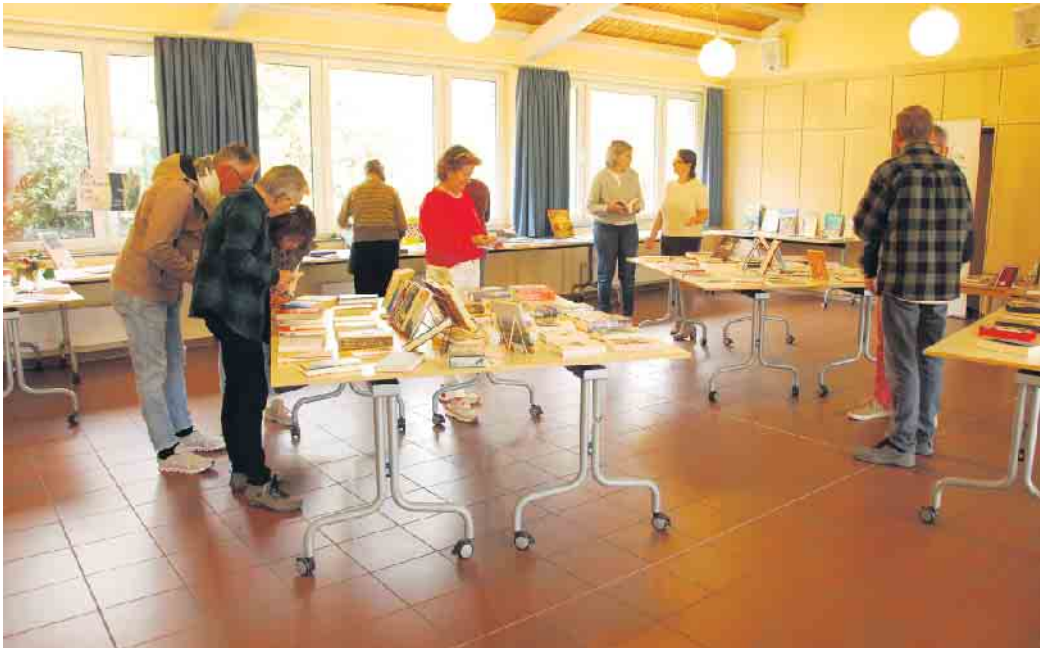
Ausstellung im Saal des Pfarrzentrums.

Oedekoven. Am 26. Oktober hatten die Mitarbeiterinnen der katholischen Bücherei in Oedekoven zu einer Buchausstellung in das katholische Pfarrzentrum am Jungfernpfad eingeladen. 24 ehrenamtliche Mitarbeiterinnen zählt die Bücherei, die an vier Tagen in der Woche geöffnet hat. Unterstützt wurde die Veranstaltung von dem Förderverein „Lesenzeichen“ „e.V., der sich seit 2004 dafür engagiert, dass die Bücherei erhalten bleibt und somit ein Zugang zu Büchern und digitalen Medien ermöglicht werden kann. Die Gäste konnten in einer großen Auswahl an brandneu erschienenen Titeln und aktuellen Kalender stöbern. Für das leibliche Wohl war in Form von einem reichhaltigen Kuchenbuffet und einer Kürbissuppe gesorgt.