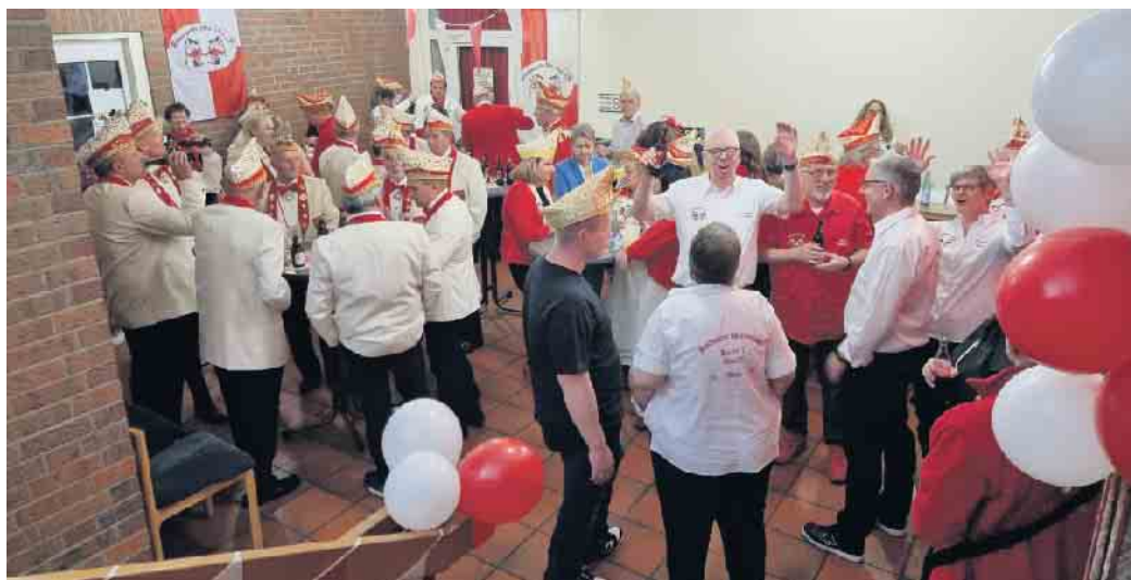
„Partyteil“ nach der Vorstellung