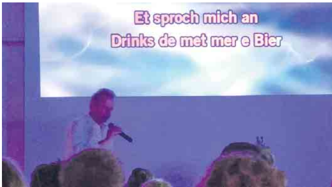
Liedtext zum ablesen und mitsingen

„Wir stellen fest, dass sich der Karneval im Rheinland verändert“ und daher bietet die AGK ein neues Veranstaltungsformat an. „Alfterer Karneval XXL - mit DJ, Danze un Kapell“ am 17. Januar 2026. Der Vorverkauf hat begonnen. Tickets gibt es bei Gabis Fotowelt. (SAPIR)