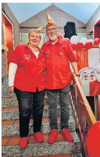
Das Jubiläumspaar.