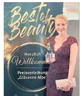
Ein weiteres Highlight: Verleihung der Gläsernen Aloe im Jahr 2022

Die Krönung erfolgte dann im Jahr 2019. Mit dem 2. Platz beim „Gloria Deutscher Kosmetikpreis“