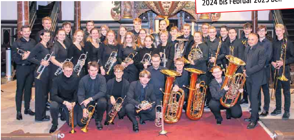
Blechbläserinnen und Blechbläser des Jugendposaunenchors spielen in Oedekoven. Bericht auf S. 2

Dieser Ausgabe liegt der Veranstaltungskalender der Gemeinde Alfter für die Monate November 2024 bis Februar 2025 bei.