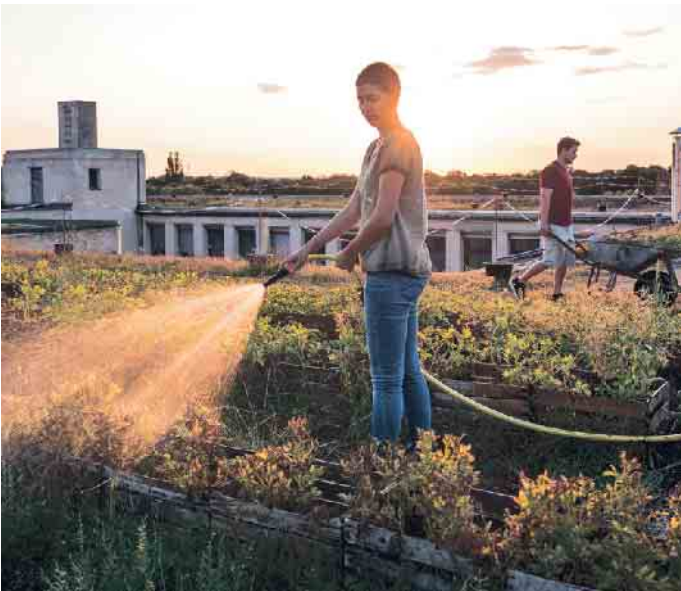
Flüssigkunststoff als Abdichtung überzeugt insbesondere durch seine Langlebigkeit, die mit einer Dachbegrünung noch zusätzlich verlängert wird.

Dachfläche anbinden. Gründächer bieten nicht nur ökologische, sondern auch ökonomische Vorteile, indem sie die Kosten für Heizung oder Klimaanlage senken. Im Winter halten die begrünten Dächer