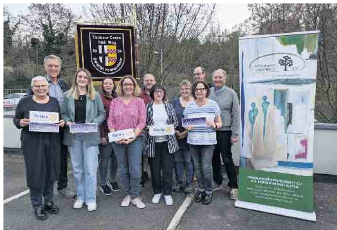
Gemeinsam freuten sich die Repräsentanten der bedachten Organisationen und der Bornheimer Rotarier bei der Übergabe der Spenden der erfolgreichen Adventskalender-Aktion 2023.

„Deshalb gilt unser ganz besonderer Dank der ungebrochenen Hilfe dieser gut 120 Unterstützer aus der Region, die es uns trotz der wirtschaftlich schwierigen Zeiten mit ihren großzügigen Spenden ermöglichen, gemeinnützige