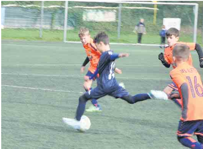
Das Spitzenspiel zwischen dem TB Witterschlick (dunkelblau) und dem VfL Alfter (orange) endete 1:1 unentschieden.