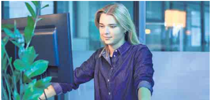
Informatikerinnen und Informatiker haben sich inzwischen auch in zahlreichen Gebieten des Fitness- und Gesundheitsmarkts etabliert.

Studiensystem der Hochschule verbindet eine betriebliche Tätigkeit und ein Fernstudium mit kompakten Lehrveranstaltungen, die digital oder an elf Studienzentren in Deutschland, Österreich und der Schweiz absolviert werden können. (DJD)