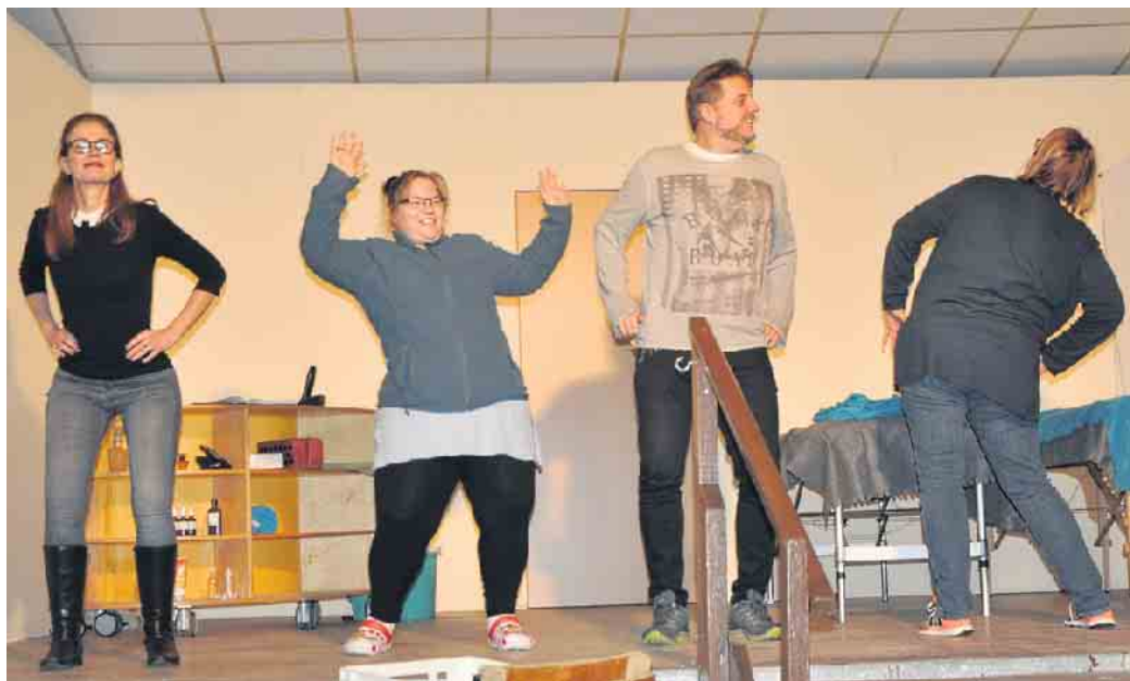
„Zickenalarm auf der Schönheitsfarm“ (Proben-Foto) begeisterte 2019 das Publikum. Dieses Jahr startet die Komödie „Für die Familie kann man nichts“ einen Angriff auf die Lachmuskeln der Zuschauer.