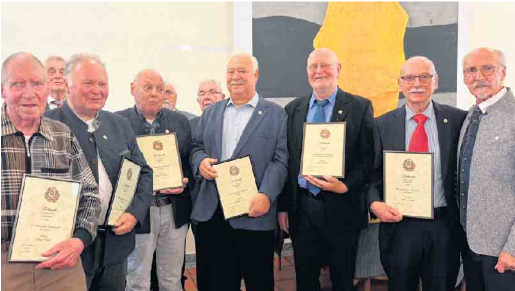
Die Jubilare.

Jährige in den Verein eingetreten. Heute ist leider nur noch Hans Gimnich als Sänger aktiv.