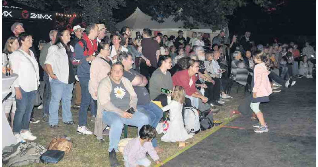
Gespannt und mit viel Freude verfolgte das Publikum die verschiedenen Bühnenshows.