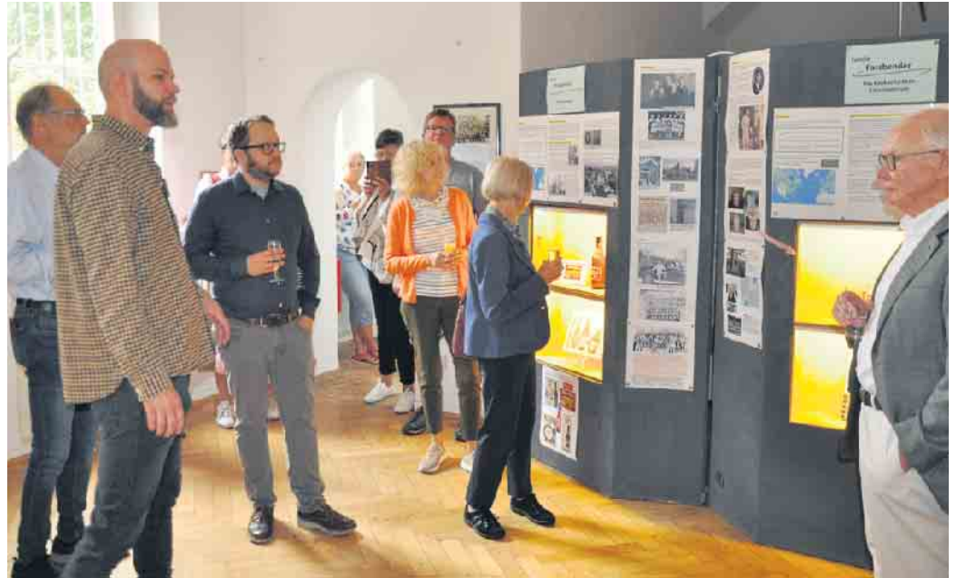
Auf informativen Schautafeln und mit anschaulichen Exponaten lässt das Haus der Alfterer Geschichte die Motive und das Leben der Auswanderer lebendig werden.