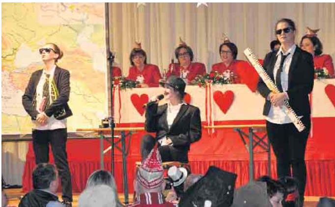
Mit eigenen Sketchen begeistern Mitglieder der „Herzblättchen“ Jahr für Jahr bei ihren Prunksitzungen.