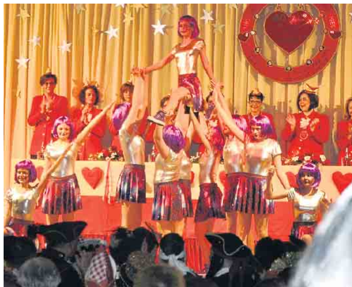
Die Tanzgruppen des Damenkomitees brillieren mit ihren Darbietungen stets aufs Neue.