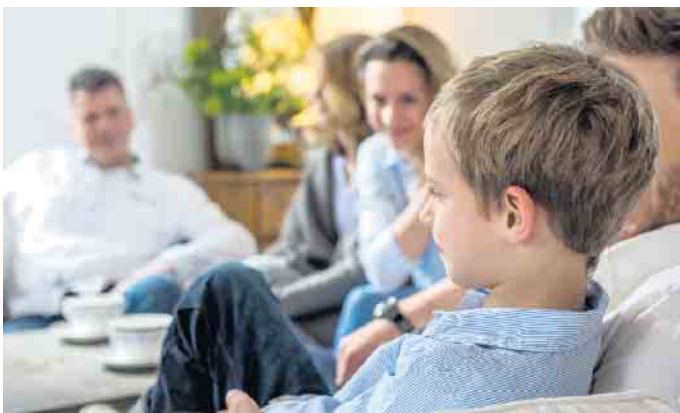
Hörprobleme bei Kindern können zu Rückzug und nachlassenden Schulleistungen führen.