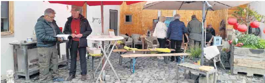
Trotz regnerischem Wetter fanden zahlreiche Besucher den Weg nach Swisttal-Ollheim und informierten sich vor Ort über Eisspeicherheizungen.

Eine Eisspeicherheizung, wie sie beispielsweise die „KlimaPatin des Jahres 2022“ in Rheinbach nutzt, ist in Kombination mit einer Photovoltaikanlage und selbstproduziertem Strom effizient und rentabel. Eine Eisspeicherheizung kann aber auch sehr aufwendig sein. Insoweit kam man in der Diskussion überein, dass