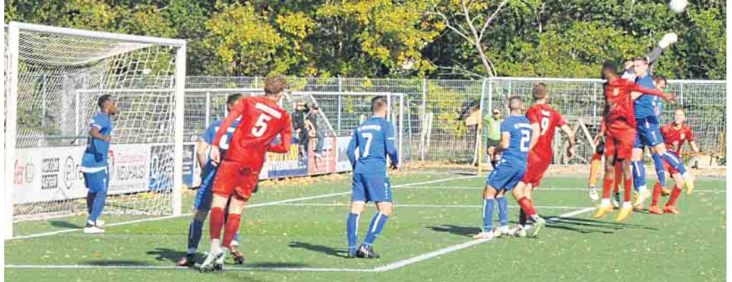
Vor allem im ersten Spielabschnitt sorgten die Alfterer (rote Trikots) für viel Alarm vor dem Gästetor.