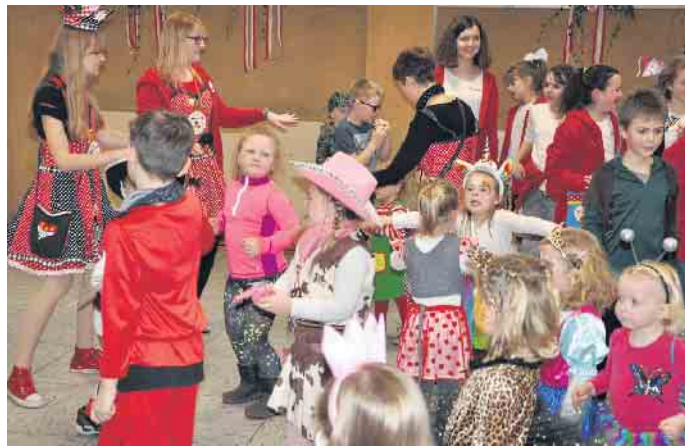
Riesigen Spaß haben die kleinen Narren bei den Kika-Feten.