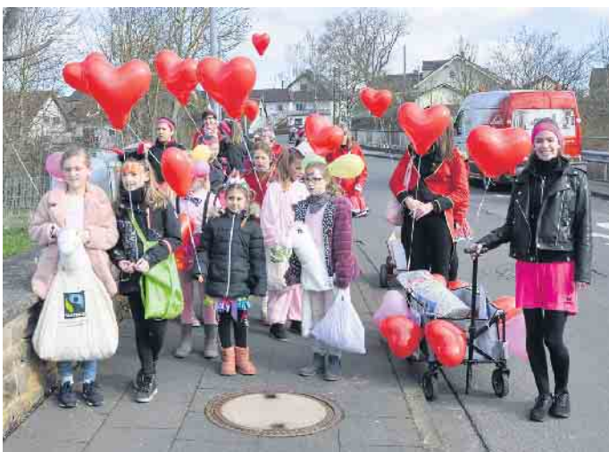
Auch wenn der Karnevalszooch 2022 nur „ze Foos“ kommen konnte, waren die „Herzblättchen“ selbstverständlich mit einer tollen Gruppe dabei.

Die „Herzblättchen“ sind heute ein unverzichtbarer Bestandteil des örtlichen Brauchtums. Das stets aufs Neue kreative und rührige Damenkomitee ist eine Perle des lokalen Geschehens in Volmershoven-Heidgen. Persönlich kann sich jeder davon bei dem umfangreichen Veranstaltungsprogramm in der Session 2022/23 überzeugen. Neben der Kölschen Nacht (22. Oktober) haben die Herzblättchen am 21. Januar die große Prunksitzung auf dem Programm. Der Kinderkarneval ist für den 22. Januar geplant, die Wieverdaachssitzung für den 16. Februar und als Höhepunkt die Teilnahme am Jubiläums-Karnevalszug am 18. Februar. Nähere Informationen und Vorverkaufsstellen unter: www.damenkomitee-herzblaettchen.de (WDK)