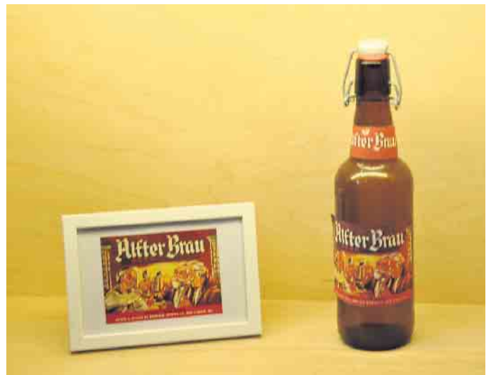
„Alfter Brau“ - eine Erfolgsgeschichte, die sich nicht hier im Vorgebirge ereignete, sondern im fernen Wisconsin (USA).