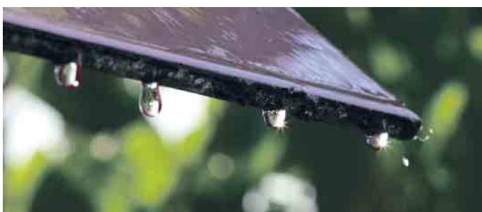
Ein großer Vorteil von Regenwasser ist dessen gute Grundqualität.

genwasserspeicher tragen zudem zum Überflutungsschutz bei. Die einfache Verfügbarkeit von Regen- wasser als erneuerbare Ressource ist ein weiterer positiver Aspekt. Darüber hinaus können Kostenein- sparungen durch die Sammlung und Nutzung von Regenwasser er- zielt werden. Je nach Gebühren- modell der Gemeinden kann sich eine solche Anlage sogar finanziell amortisieren. „Aufgrund der immer länger anhaltenden Trockenperio- den sollten die Regenwasserzist- ernen allerdings ausreichend groß geplant werden“, rät Ringelstein. (akz-o)