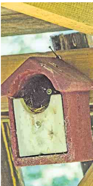
Sauber und gut geschützt vor Witterung und Feinden sollte die Vogelbehausung sein.

osten zeigt, um vor der Witterung geschützt zu sein. Im Frühling ziehen dann neue geflügelte Mieter sicher gerne ein. (DJD).