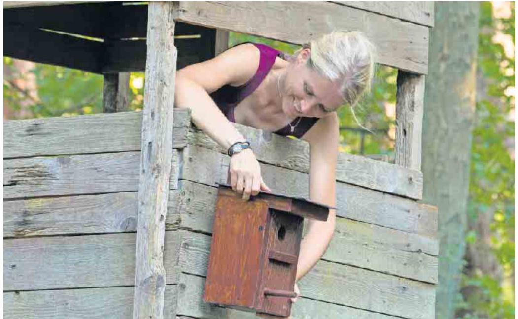
In Nistkästen können sich Parasiten und Krankheitserreger vermehren. Deshalb ist es wichtig, sie regelmäßig zu reinigen.

Erst anklopfen, dann ausbürsten Der Deutsche Jagdverband (DJV) empfiehlt, vor dem Putzen kurz anzuklopfen und das Häuschen vorsichtig zu öffnen. Denn schon ab September können Zwischengäste wie Siebenschläfer oder Haselmaus dort ihren Winter-