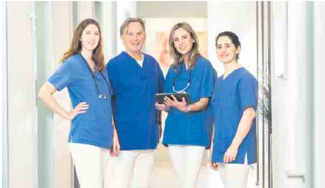
Das Team der dental suite im Kölner Rheinauhafen

Dementsprechend ist die Patientenzufriedenheit in Bezug auf die Ästhetik, die Sprechweise und das Selbstbewusstsein in aller Regel besser als mit einer herausnehmbaren Zahnprothese. Vorteile gegenüber Implantaten Durch das All-on-4® Behandlungskonzept werden alle Zähne im Ober- oder Unterkiefer während eines einzigen Eingriffs ersetzt. Würde stattdessen für jeden fehlenden Zahn ein eigenes Implantat eingebracht werden, könnte sich der Behandlungsverlauf über Monate hinziehen. Durch All-on-4® erhalten die Patienten hingegen feste, dritte Zähne an einem Tag, die sie zudem sofort voll belasten können. Kostengünstig und patientenfreundlich Gerade im Vergleich zu einem vollständigen Zahnersatz mit Implantaten ist das All-on-4® Konzept eine vergleichsweise kostengünstige Behandlungsoption. Darüber hinaus kommt die Methode auch Angstpatienten sehr entgegen, da der gesamte Be-