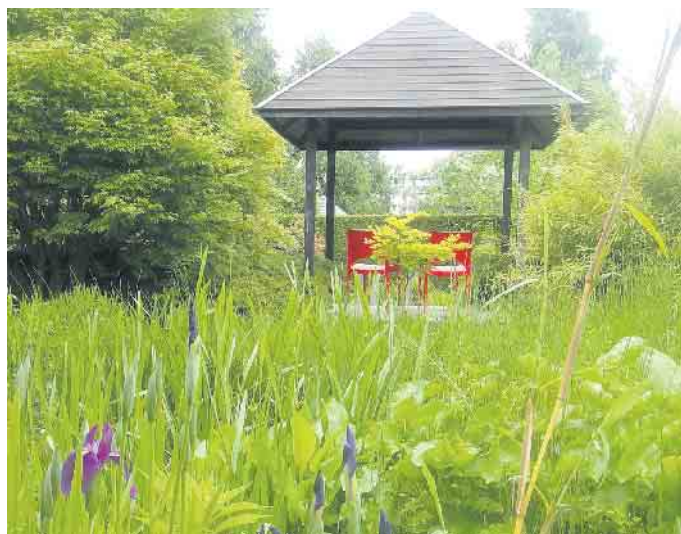
Mit Pflanzen, für die nasse Füße kein Problem sind, lassen sich auch Gartenbereiche mit Staunässe attraktiv gestalten.

nicht von Rosen- oder Staudenbeeten, die man ja auch in den meisten kleinen Gärten findet.“ Weitere Informationen rund um professionelle Gartengestaltungen gibt es auf www.mein-traumgarten.de . BGL