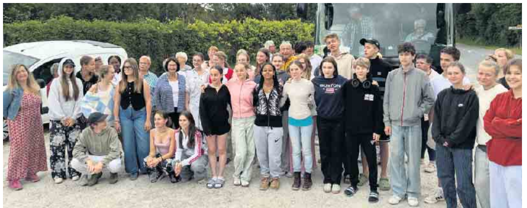
Die Chorgemeinschaft Volmershoven-Heidgen e.V. gab ein kleines spontanes Konzert während des Marktes in Châteauneuf-sur-Charente.

Charente fand in der Kirche statt. Danach trafen sich alle mit über 100 Teilnehmenden zum offiziellen Empfang im „Salle des Fêtes“ mit gemeinsamen Essen, Musik und Tanz.