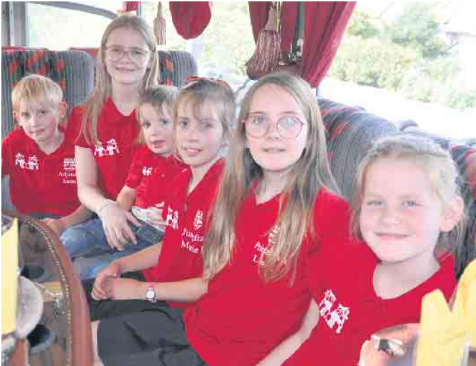
Das kommende Alfterer Kinderdreigestirn enterte gleich den gediegenen Show-Bus und ließ es sich gut gehen.