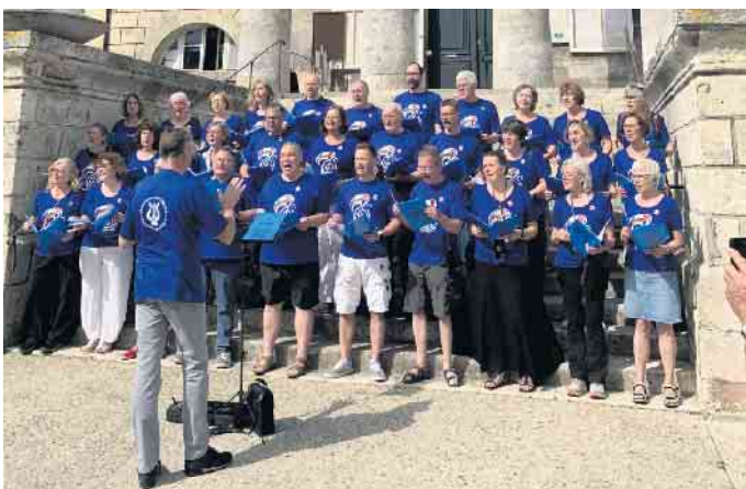
Die deutschen Schüler*innen mit Begleitpersonen bei der Abfahrt nach Alfter.

Zu Christi Himmelfahrt 2026 wird der Besuch von den französischen Freunden nach Alfter erwidert. Wenn Sie Interesse an diesem Austausch haben, melden Sie sich gerne beim Partnerschaftsverein: www.alfter.de/rathaus-politik/staedtepartnerschaften