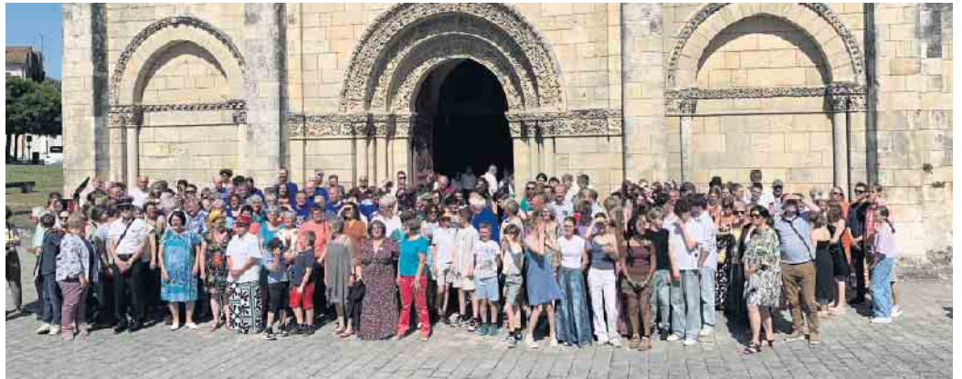
Die Gäste aus Alfter mit ihren französischen Freunden und Gastfamilien vor der Kirche in Châteauneuf-sur-Charente.

Ein gemeinsames Konzert der beiden Chöre aus Volmershoven-Heidgen und aus Châteauneuf-s/