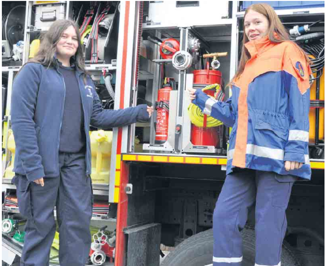
Die Jugendfeuerwehr wird wieder Einblicke in ihre ehrenamtliche Tätigkeit geben.