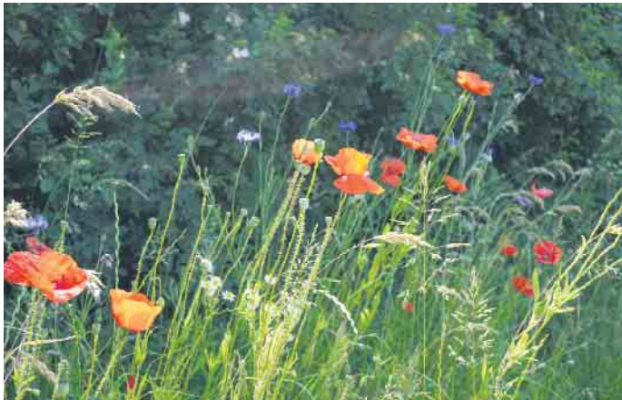
Blühender Wegrain aus dem Projekt „Vernetztes Rainland“.

Internationalen Zentrum für Nachhaltige Entwicklung (IZNE) der Hochschule Bonn-Rhein-Sieg (H-BRS) kamen verschiedenen Interessengruppen aus dem Rheinland zusammen, um Lösungen für mehr Artenschutz in der Landwirtschaft zu finden.