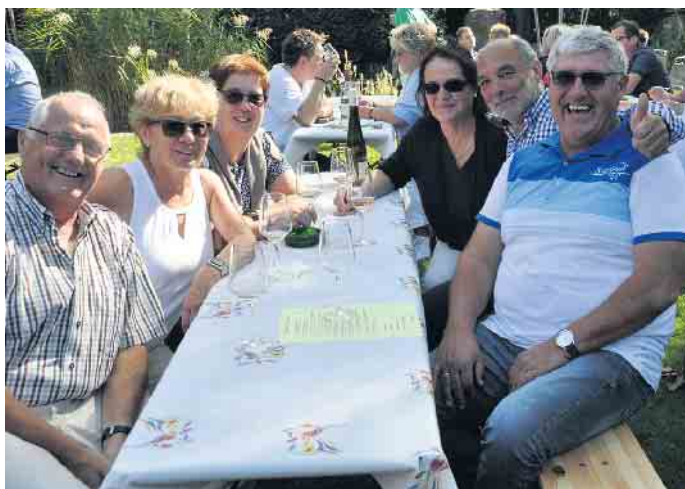
Im historischen Marienhof der Weinhandlung Antwerpen lässt es sich bei Wein und Snacks bestens aushalten.

ihre Gäste. Der Hof Decker und der Hof Mertens bieten hausgemachte Gerichte an und die Osteria Vicentina italienischen Köstlichkeiten. Mit einem speziellen Büffet lockt das China-Restaurant „Kaiser Garden“. Für flüssige Nahrung sorgt eine Wein-, Sekt- und Champagnerbar vor dem Möbelhaus Bovelet. Dort werden auch Mythos Bier und griechische Spezialitäten angeboten. Wer es süß mag, kann hier fair produzierte Schokolade und Pralinés naschen - und zu allem gibt es die passenden Kaffee- und Ginspezialitäten. Sollte es regnen, sorgt erstmals ein Zelt auf dem Parkplatz für trockenen Genuss. Bei der Weinhandlung Antwerpen locken frischer Federweiß und feine Weine zum Kosten und Kaufen. Darüber hinaus gibt es an diversen