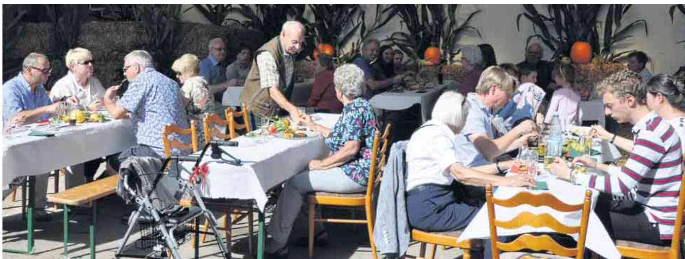
Schmackhafte hausgemachte Gerichte servieren die Höfe Decker und Mertens.