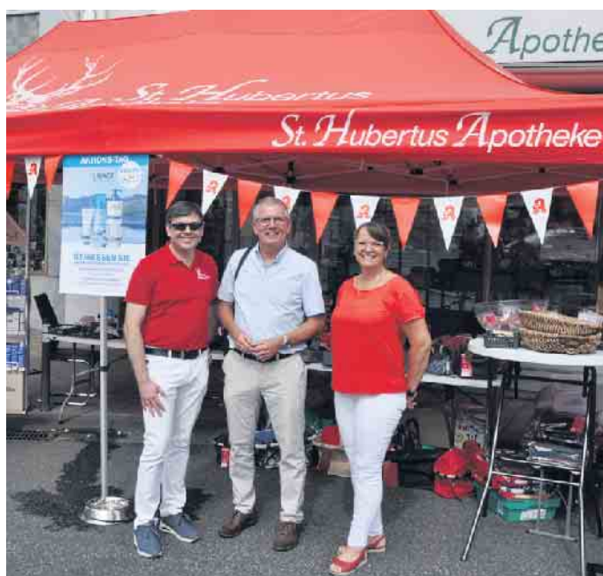
Bornheims Bürgermeister Christoph Becker (Mitte) lässt es sich nicht nehmen, neben der Eröffnung sich ausführlich über die Angebote bei der Gewerbeschau zu informieren.