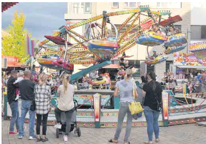
Kirmesspaß vom Feinsten warten auf Groß und Klein auf dem Peter-Fryns-Platz.

In diesem Jahr findet die Bornheimer Großkirmes von Freitag, 1. September, bis Dienstag, 5. September, auf dem Peter-Fryns-Platz statt. Sie ist an allen Tagen von 11 bis 22 Uhr geöffnet.