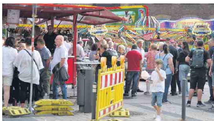
Mit jede Menge Attraktionen lockt die Großkirmes Jahr für Jahr viele Gäste in die Bornheimer Innenstadt.

35. Bornheimer Gewerbeschau. Die Bezeichnungen „Großkirmes“ und „Kleinkirmes“ sagen nichts über die Größe der jeweiligen Veranstaltung oder die Zahl der teilnehmenden Schausteller und Buden aus, sondern sie richten sich nach deren zeitlicher Dauer. Eine Großkirmes wie die Bornheimer findet dieses Jahr an fünf Tagen statt (Freitag bis Dienstag), eine Kleinkirmes in der Regel nur an drei (Samstag bis Montag). Die Großkirmes in Bornheim findet traditionell immer am 1. Sonntag im September statt und die Kleinkirmes zu Ehren des Heiligen Servatius jeweils im Mai. (WDK)