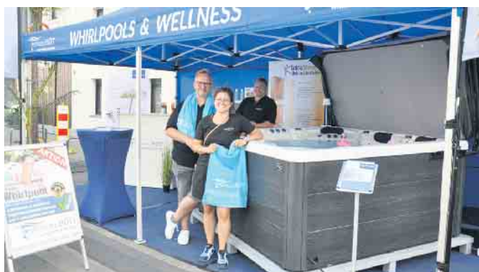
Gerade für junge Unternehmen bietet die Gewerbeschau eine hervorragende Plattform.