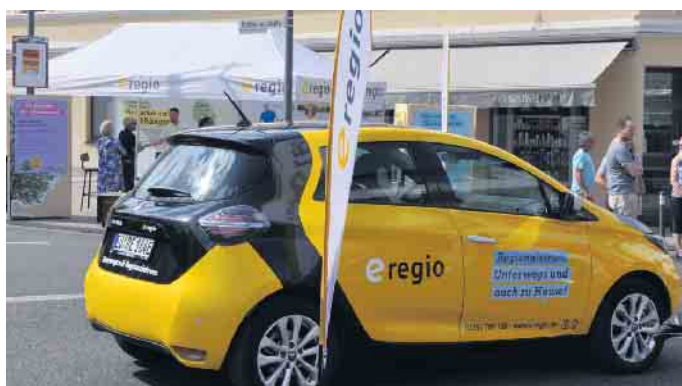
Elektromobilität und Energiesparmaßnahmen nehmen an den Ständen der Autohäuser und Energieunternehmen breiten Raum ein.

Fahrradmobilität oder Bekleidung, Spezialitätengeschäfte oder Fitness- und Wellnessangebote und vieles andere mehr - es ist für jeden Geschmack etwas dabei. Zudem bietet der Verkaufsoffene Sonntag eine besondere Gelegenheit, sich bei den Händlern und Dienstleistern umfassend zu informieren - und das ganz ohne Kaufdruck.