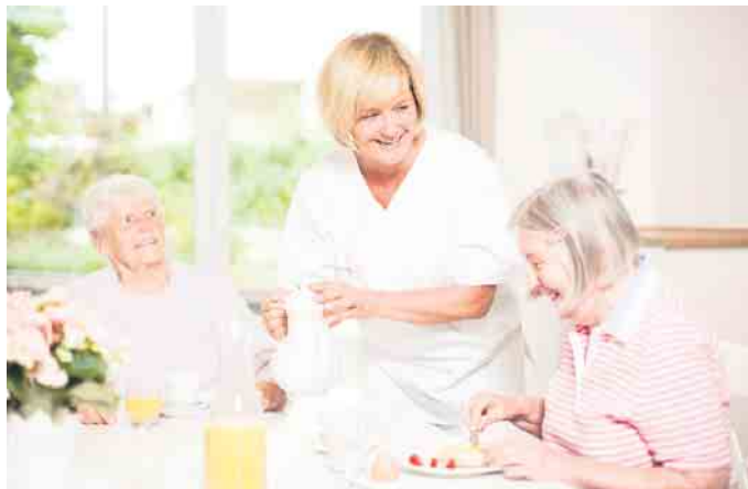
Gut versorgt in der Tages-Betreuung des Pflege teams Wentland

Rund um solche Fragen infor- miert das Pflege team Went- land an unterschiedlichen Ter- minen im August - jeweils um 18:00 Uhr.