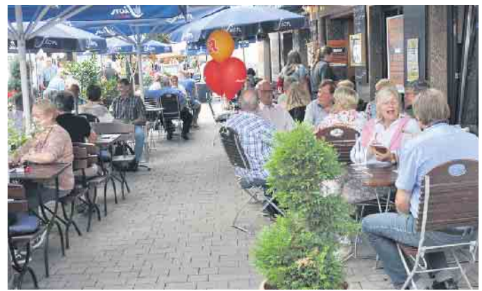
Für gemütliche Pausen laden die gastronomischen Betriebe und Stände zum Genießen und Plaudern ein.