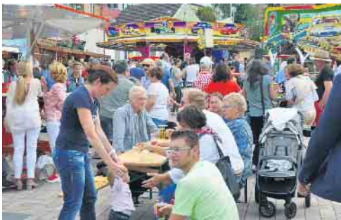
Kirmes-Atmosphäre verzaubert nicht nur die Kleinen, sondern hier finden auch die Großen jede Menge attraktive Zerstreuung.

6. September nach zweijähriger Corona-Pause wieder auf dem Peter-Fryns-Platz statt. Sie ist an allen Tagen von 11 bis 22 Uhr geöffnet. Spaß und Spannung erwartet die kleinen Besucher bei Belustigungen wie Kinderkarussell, Entenangeln und Kindertwister. Darüber hinaus können Kirmesgänger am „Greifer“ sowie an der Schieß- und Losbude ihr Glück versuchen. Ferner