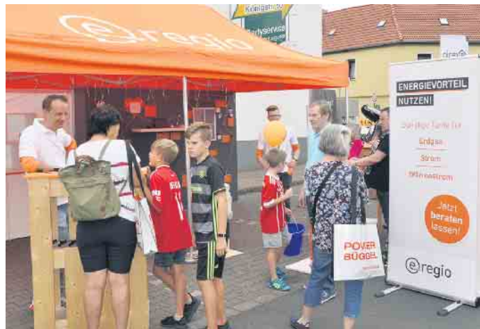
Kompetente Beratung über Energiesparmaßnahmen stehen an den Ständen der Energieunternehmen im Mittelpunkt.