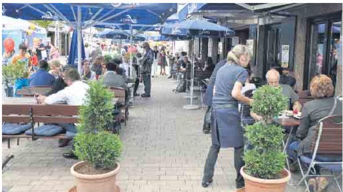
Für gemütliche Pausen laden die gastronomischen Betriebe und Stände zum Genießen und Plaudern ein.

Die Bornheimer Großkirmes lockt auf dem Peter-Fryns-Platz die Besucher sogar von 11 bis 22 Uhr - und das an allen fünf Kirmestagen (2. bis 6. September). Bornheim präsentiert sich an diesem ersten Wochenende im September erneut als Zentrum des Vorgebirges. Das sollten Sie sich auf keinen Fall entgehen lassen. Seien Sie dabei und überzeugen Sie sich von einer lebendigen und attraktiven Veranstaltung mit ihren vielfältigen Angeboten im Herzen Bornheims. Ein Besuch lohnt sich auf alle Fälle. Sie werden mit vielen neuen Eindrücken nach Hause gehen. (WDK)