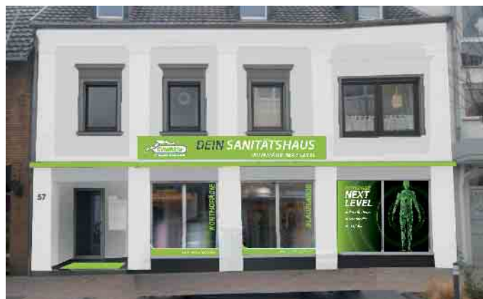
So wird die Ladenfassade des neuen Gütelhöfer Sanitätshauses an der Bornheimer Königstraße aussehen. (Animation: Agentur Fabelhaft)

Egal bei welcher Sportart - es werden außergewöhnliche Anforderungen an Körper und Bewegungsapparat gestellt. Um diese bestmöglich zu meistern, sind ge-