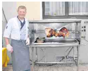
Da läuft einem das Wasser im Munde zusammen wie hier beim Angebot der Metzgerei Breuer.