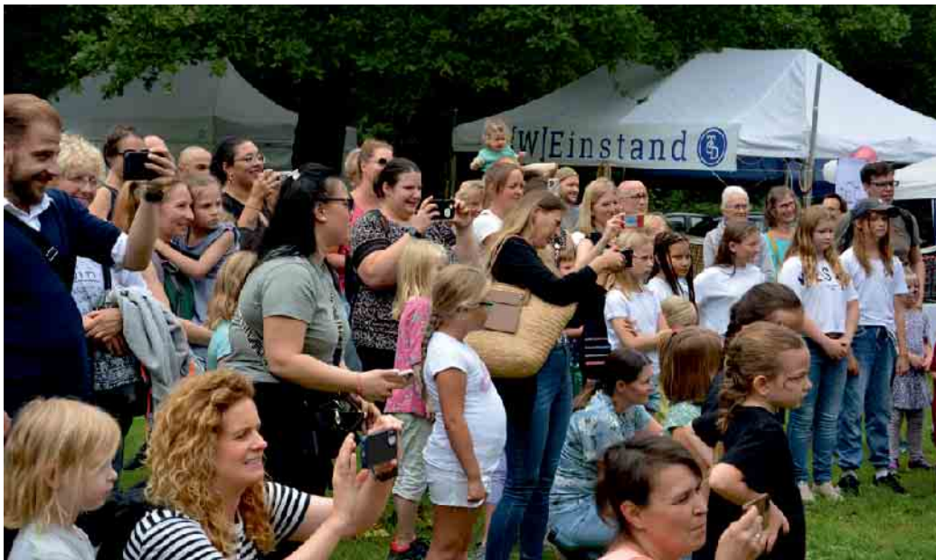
Derletalfest: seit Jahren ein großes Fest für die ganze Familie.

Hardtberg. Am Samstag, 24. August, findet im Stadtbezirk Hardtberg von 14 bis 23 Uhr das 38. Derletalfest statt. Bestandteil des Derletalfestes bleibt das Musikfestival „Rock im Tal“. Dieses beginnt in diesem Jahr um 17 Uhr.