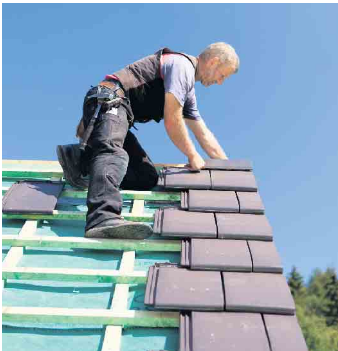
Wer viel im Freien arbeitet, sollte sich mit medizinischer Sonnenlotion und der richtigen Bekleidung vor UV-Strahlen schützen.

diesen Stunden die Arbeit in den Schatten verlegt werden. Hier sind auch Arbeitgeber in der Pflicht, die außen liegenden Arbeitsstellen abzuschirmen beziehungsweise zu überdachen. Und nicht zuletzt können sorgfältige Selbstbeobachtung und regelmäßige Vorsorgeuntersuchungen beim Hautarzt helfen, Hautkrebs möglichst frühzeitig zu entdecken und behandeln. (DJD)