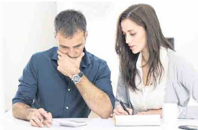
Rund um den Grundstückserwerb ergeben sich viele Fragen - sowohl praktischer als auch rechtlicher Natur.