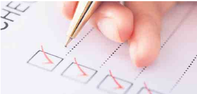
An alles gedacht? Eine Checkliste trägt dazu bei, dass man beim Grundstückskauf alle wichtigen Punkte beachtet hat.

5. Das Grundbuch ist auf eingetragene Rechte und Belastungen zu überprüfen. Wege- und Leitungsrechte etwa können die Bebauungsmöglichkeiten erheblich einschränken. (djd)