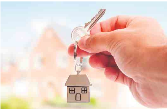
Die Wahl des richtigen Grundstücks ist die wichtigste Entscheidung des angehenden Bauherrn. Nur dann kann das Projekt beim Einzug zu einem glücklichen Ende führen.

2. Ein Bodengutachten verschafft Klarheit über die Beschaffenheit und Tragfähigkeit des Baugrunds. Es sollte vom neuen Eigentümer so früh wie möglich eingeholt werden, das Geld dafür ist im Hinblick auf die potenziellen Folgekosten sehr gut inves-