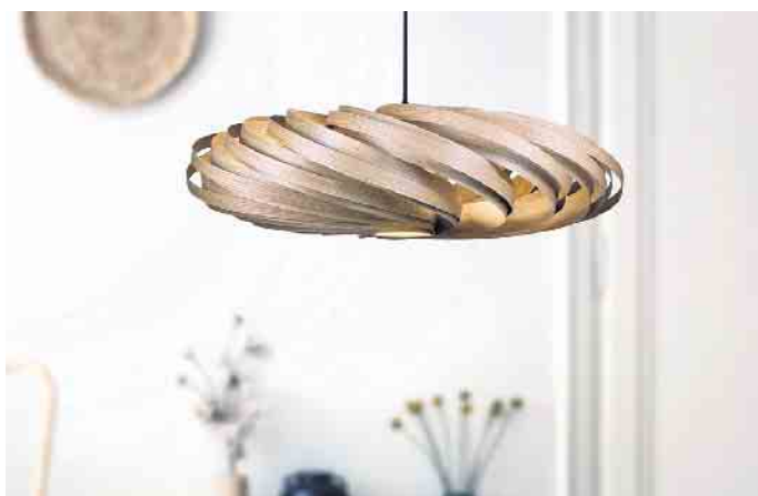
Mit Furnierleuchten wird jeder Raum aufgewertet.