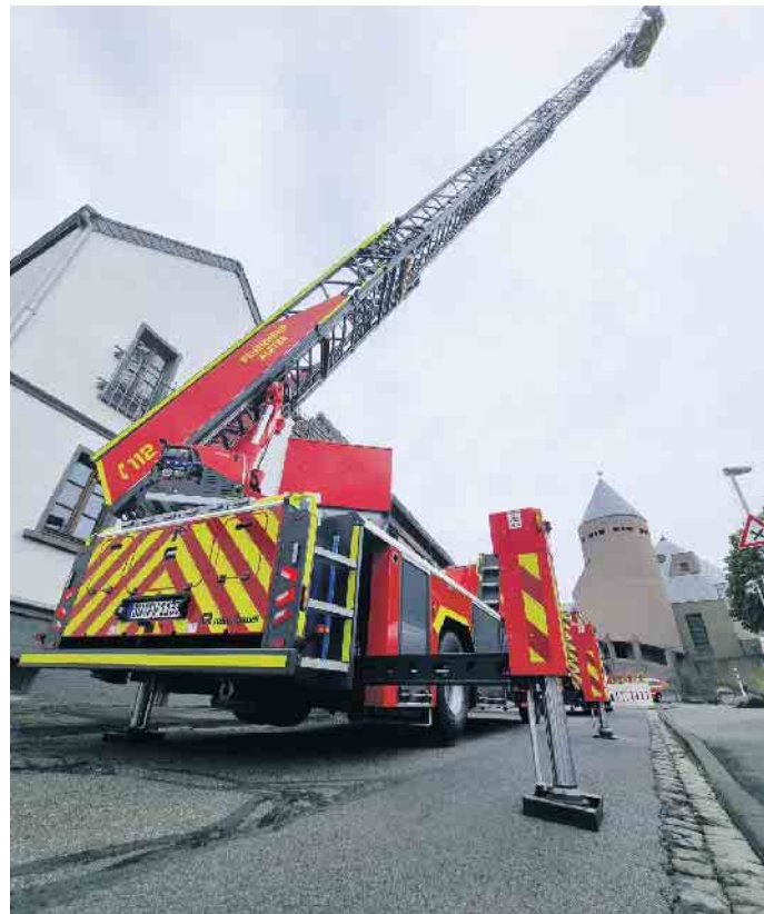
Fahrzeugschau mit Drehleiter.

Ihre Alternative für Bonn! Citroën-Service