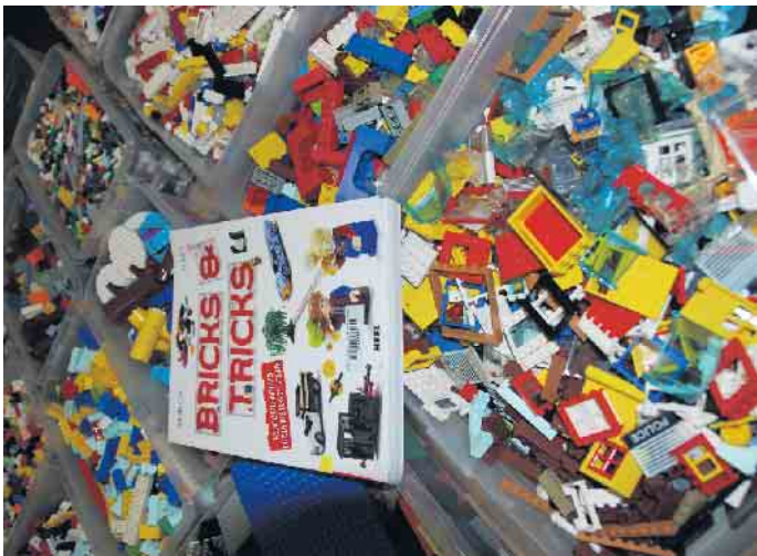
Legosteine in allen Farben