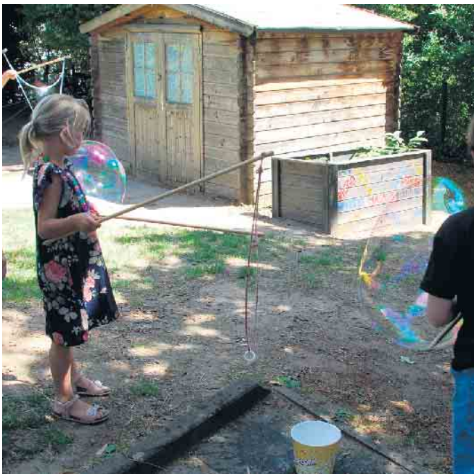
Große Seifenblasen.

Alfter-Gielsdorf. „Endlich wieder Pfarrfest“, freuten sich die vielen Besucher, die bei herrlichem Wetter nach Gielsdorf gekommen waren. Dazu eingeladen hatte der Pfarrausschuss. Gestartet wurde um 11 Uhr mit einem Familiengottesdienst in der katholischen Kirche St. Jakobus in Gielsdorf, der musikalisch durch den Kinderchor der Mittelmgemeinden begleitet wurde. Im Anschluss ging es rund um das Pfarrheim in der Blechgasse weiter, wo für das leibliche Wohl bestens gesorgt war. Für die Kinder wurden Spiele angeboten. Besonders beliebt war das Spielen mit den übergroßen Seifenblasen. Die Katholische Bücherei bot in einem der Räume ihren Bücherflohmarkt an, was viele „Leseratten“ freute, die ihren Bedarf an Lesestoff decken konnten.