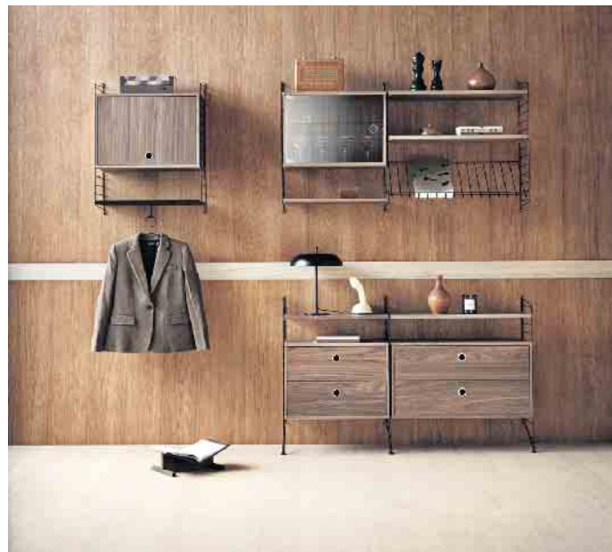
Edel und einzigartig: Furnierte Möbel.

info@tobiasgregor.de • www.tobiasgregor.de