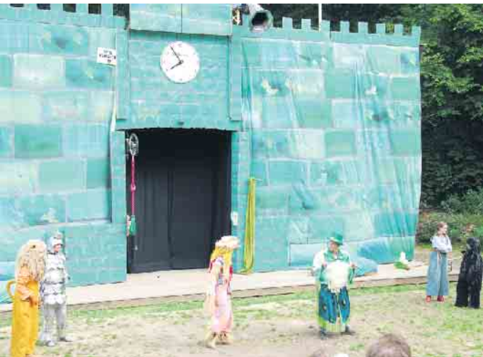
Der Zauberer vor seinem großen Schloss

Gefördert wird der Verein von Spenden vom Land NRW und der Faßbender-Stiftung und anderen, sodass keine Mitgliedsbeiträge gezahlt werden. Unterstützung kommt auch in diesem Jahr wieder vom Verein für Menschen mit Behinderung. Zwei Vorstellungen sind speziell für Gehörlose. Es wird simultan in Gebärdensprache übersetzt. Die Vorstellungen finden von Juli bis September statt. (SPI)