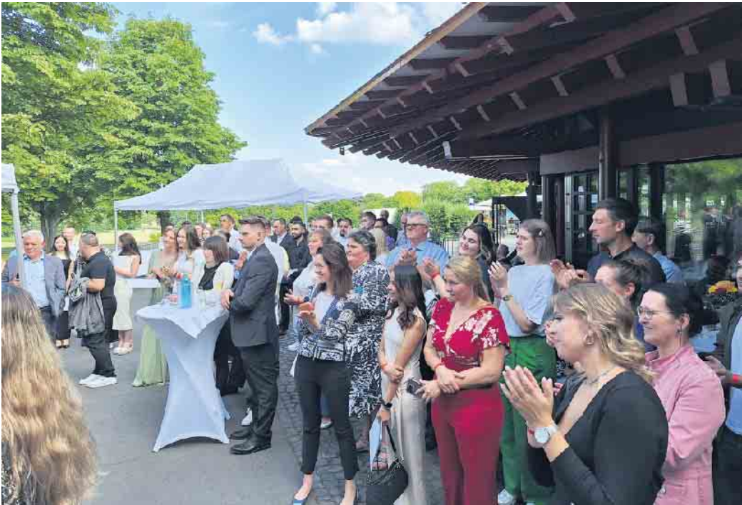
Einige der 170 anwesenden Gästen zur Lossprechung

Die Hotel- und Gaststätteninnung Bonn/Rhein-Sieg gratuliert allen Absolventinnen und Absolventen herzlich und wünscht ihnen für ihren weiteren Berufsweg viel Erfolg und Freude.