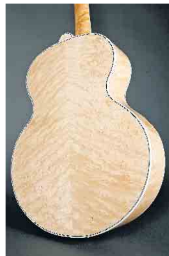
Ahorn-Furnier verleiht dieser Gitarre das gewisse Etwas.

Zülpich. Mit Furnier lassen sich kreative und individuelle Projekte aller Art verwirklichen. Die Basis dafür bilden speziell ausgesuchte Bäume, die mit viel Know-how zu dem edlen und natürlichen Material verarbeitet werden. Nur sehr wenige der gut 40.000 auf der Erde vorkommenden Holzarten lassen sich zu hochwertigem Furnier verarbeiten. „Rund 140 Arten kommen für die Herstellung in Frage und innerhalb dieser Arten gibt es nur wenige Exemplare, die mit innerer Schönheit punkten und sich damit für die Produktion von Furnieren eignen“, so der Forstwirt und Vorsitzende der Initiative Furnier + Natur (IFN), Axel Groh. Notwendig ist unter anderem ein ebenmäßiger Wuchs und der Stamm muss für eine perfekte Verarbeitung möglichst rund und kerzengerade sein. „Auch ein gleichmäßiges Rindenbild ist wichtig - am besten ohne störende, große Äste“, so Groh. Spuren von Blitzschlag, Hagel oder Insektenbefall führen ebenfalls dazu, dass ein Baum als Furnierlieferant ausscheidet. Ist das richtige Exemplar schließlich von einem geschulten Auge ausgesucht und ins Furnierwerk transportiert worden, wird der Baum-