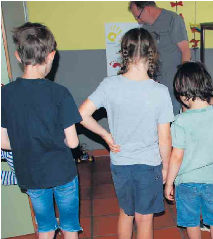
Besuch im Lego-Treff

die Kinder, wie sich der kleine Roboter bewegte und sie waren natürlich begeistert, als es hieß: Den dürft ihr nachbauen. Wer den Lego-Treff auch einmal unterstützen möchte, der ist herzlich willkommen, denn Legos sind nicht nur etwas für Kinder. Nach den Sommerferien geht es am 20. September weiter. (SPI)