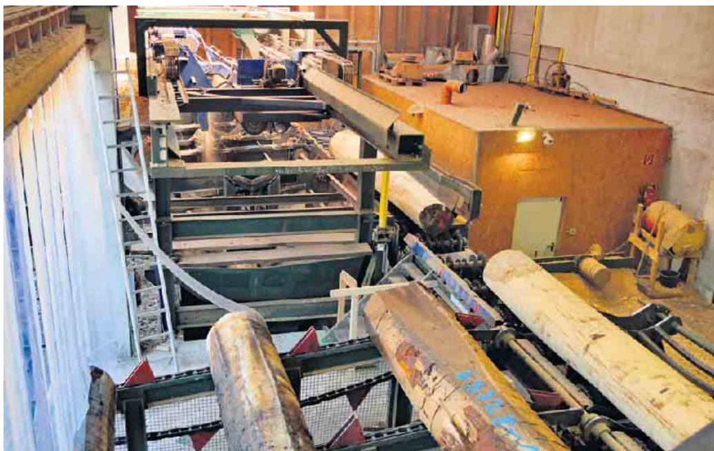
Furnierbäume bei der Verarbeitung.

„Sogar Kiteboards für Wassersportler, Abfahrtsski für die kalte Jahreszeit oder auch Longboards für Sonnenanbeter in der Stadt und auf dem Land können heute mit Furnier hergestellt bzw. veredelt werden“, so Klaas. Auch aus dem Musik-Business ist Furnier nicht wegzudenken. Seien es Streich- und Zupfinstrumente, raffiniert gemusterte Schlagzeuge, Bässe und E-Gitarren oder edle Klaviere und Konzertflügel: Fur-