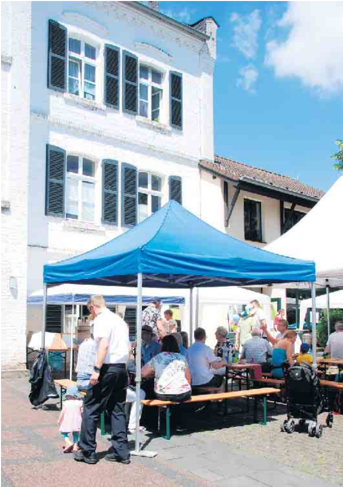
Vor dem Pfarrheim in der Blechgasse