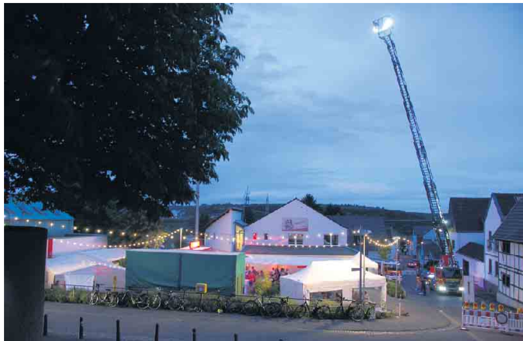
Fest auf dem Dorfplatz

Der nächste Morgen begann erst einmal außerplanmäßig mit einer Warnmeldung des Rhein-Sieg-Kreises. Erneut brannte es bei der Entsorgungsfirma Hündgen in Swisstal. Es konnte aber entschieden werden, dass das Fest