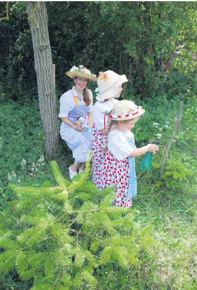
Wegbegleiter auf dem gelben Weg.