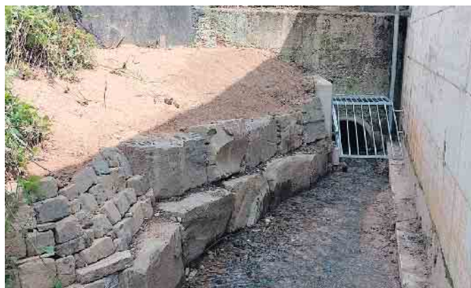
Räumlicher Rechen Einlaufbauwerk Markeskaulenbach/Einlauf Ahrweg

Die Ergebnisse aus dieser Beteiligung, die angepasste Starkregengefahrenkarte, die Überprü-