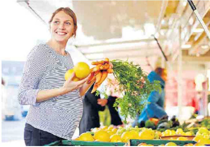
Ein gesunder Lebensstil kann das Risiko von Schwangeren, an einem Gestationsdiabetes zu erkranken, verringern.

Werte messen und normalisieren Ziel einer Therapie ist es, die Blutzuckerwerte in einem bestimmten Zielbereich zu halten. Dies kontrollieren die Patientinnen selbst, indem sie regelmäßig ihren Blutzucker messen und dokumentieren. „Moderne Blutzuckermessgeräte wie Accu-Chek Guide ermöglichen