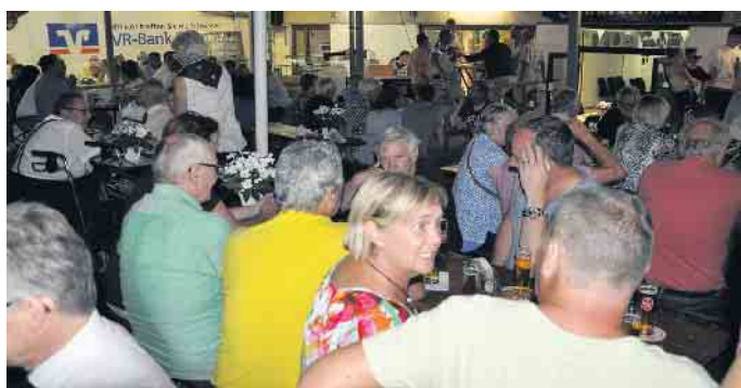
Bester Laune feierten 2022 die Schützen und ihre Gäste nicht nur während des Königsschießens.

mersabend mit Tanz am 23. ebenfalls auf dem Schützenplatz September (Beginn: 18 Uhr) sein.(WDK)