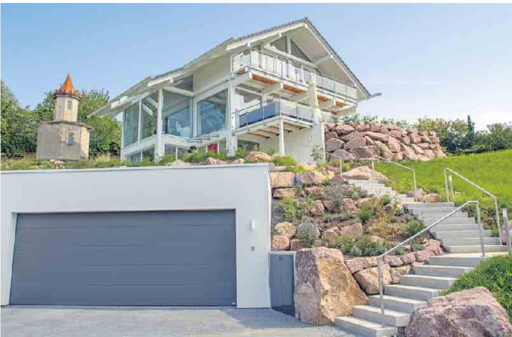
Auf Hanggrundstücken bieten Keller attraktive Möglichkeiten für Stauraum und lichtdurchflutete Wohnräume - wahlweise kombiniert mit einer Garage.