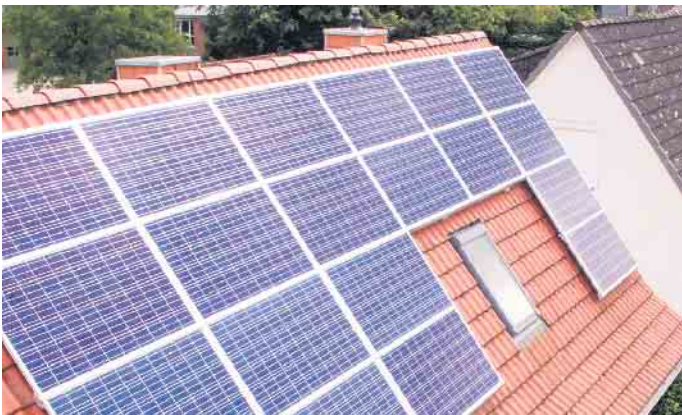
Vorausschauende Investitionen reduzieren auch die „2. Miete“

positiv auf den CO 2 -Fußabdruck eines Wohngebäudes ein. Nebenkosten senken Angesichts hoher Preise für Öl, Gas und Strom können Bauherren durch nachhaltiges Modernisieren den Energieverbrauch und damit langfristig auch Kosten senken. Klassische Maßnahmen sind etwa die Dämmung der Gebäudehülle und der Fensteraustausch. Die Außendämmung eines Gebäudes kostet zwischen 100 und 200 Euro pro Quadratmeter, moderne Wärmeschutzfenster schlagen mit je 500 bis 780 Euro zu Buche. „In acht bis 15 Jahren haben sich diese Maßnahmen amortisiert“, sagt der BHW Experte, „und als angenehmer Nebeneffekt steigt die Wohnqualität deutlich.“ Auch der Einbau eines modernen Heizkessels, einer Wärmepumpe oder einer Solarthermie-Anlage fährt die Energiekosten deutlich