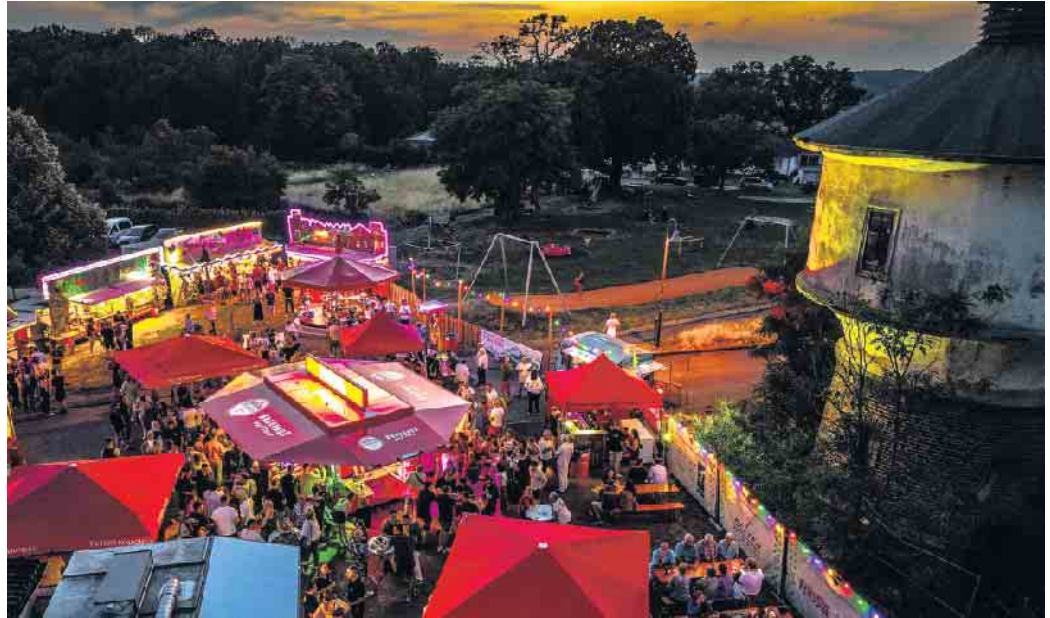
Abendliches Ambiente auf der Kleinkirmes

Nach der Kirmes ist vor der Kirmes - in ein paar Wochen findet an gleicher Stelle die Gielsdorfer Großkirmes statt. Hier laufen die Vorbereitungen bereits auf Hochtouren. Highlight in diesem