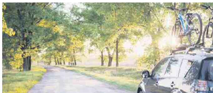
Etwa jeder Zweite nutzt in Deutschland das Auto, um ans Urlaubsziel zu gelangen.

Neben den üblichen Verbandsmaterialien und Warnwesten gehören seit Jahresbeginn 2022 zwei medizinische Masken zur vorgeschriebenen Mindestausrüstung. (djd)