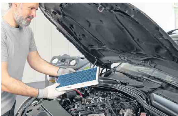
Ein neuer Innenraumfilter sorgt auch an heißen Tagen für gesunde Bedingungen im Fahrzeuginneren.

Reparatur-Annahme/Verkauf geöffnet ab 7.30 Uhr Samstag Notdienst von 9.00 - 12.00 Uhr