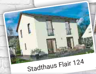
Stadthaus Flair 124