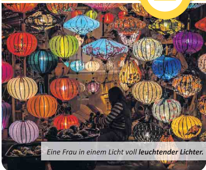
Eine Frau in einem Licht voll leuchtender Lichter.