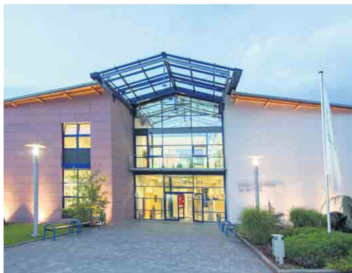
Das Bundesausbildungszentrum der Bestatter.

Wer heute die Ausbildung zur Bestattungsfachkraft erfolgreich durchläuft, kann sicher sein, den Anforderungen des Bestatterberufs auch morgen gewachsen zu sein. Berufsbegleitende Fort- und Weiterbildungsmaßnahmen sind weitere Garantien für die Qualitätssicherung im Bestattungsgewerbe. (akz-o)