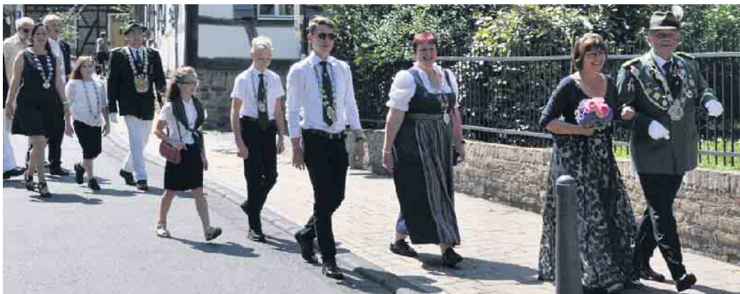
Coronabedingt zog zuletzt 2019 der traditionelle Schützen-Festzug durch den Alfterer Ortskern