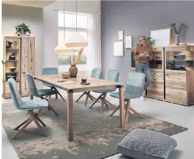
Zeitlos schöne Qualitätsmöbel bereiten ihren Besitzern lange Freude.

Damit Möbel viele Jahre lang eine gute Figur machen sowie sicher und zuverlässig funktionieren, sollten Endverbraucher beim Möbelkauf auf Qualität achten. Die erkennen sie allen voran am RAL Gütezeichen „Goldenes M“. Dieses Qualitätssiegel beruht auf dem umfassendsten Anforderungskatalog für Mö-