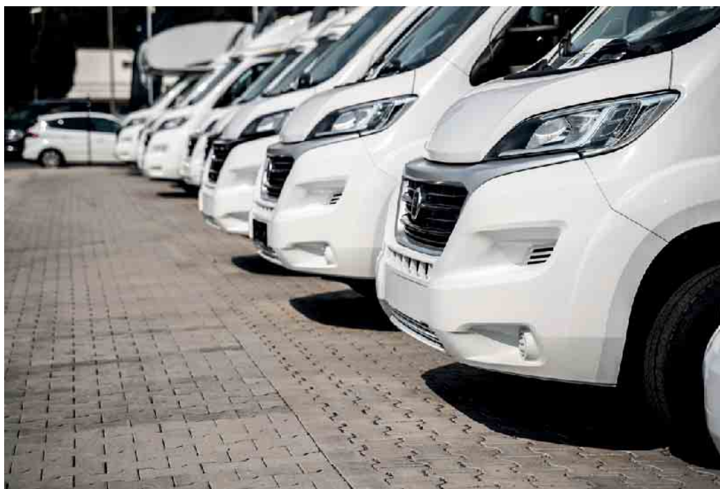
Wohnwagen sind aktuell sehr beliebt.