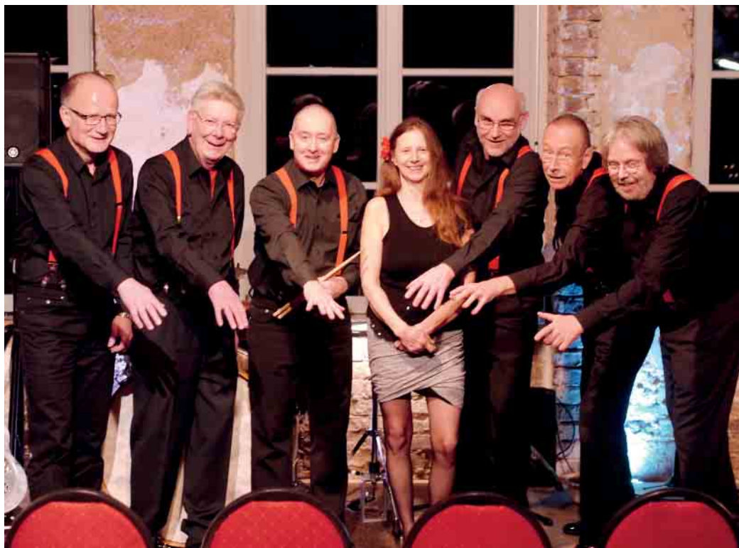
Jazz in traditioneller Besetzung: Red Onion zu Gast im Kulturzentrum Hardtberg

Ein Wiedersehen und -hören erfolgt am darauffolgenden Sonntag, 14. Juli, mit Red Onion. Red Onion, das ist Jazz in der traditionellen Besetzung Kornet, Posaune, Klarinette, Saxophon, Banjo, Gitarre, Kontrabass und Piano.