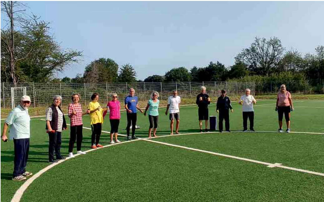
ASC-Senioren bei der Morgengymnastik