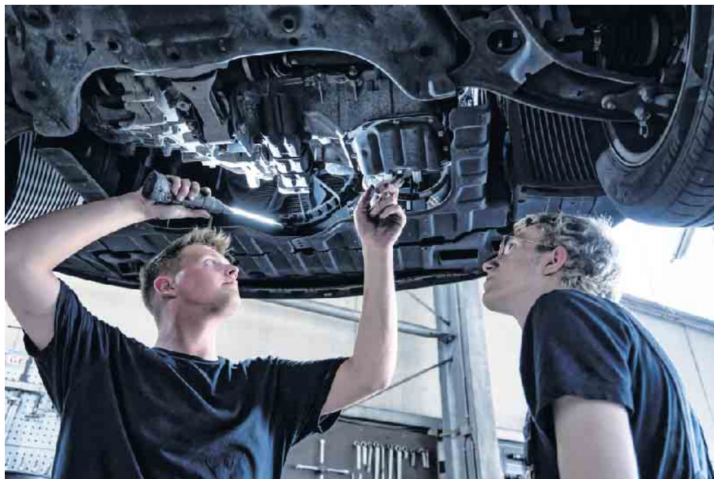
Beim Klimaanlage-Check prüft der Kfz-Mechaniker alle Teile der Anlage und ihre Funktionen.

Der Zentralverband Deutsches Kfz-Gewerbe weist auf Probleme hin, die durch eine mangelhafte Wartung entstehen können. Ein niedriger Stand des Kältemittels etwa kann die Leistung beeinträchtigen und zu Schäden am Kompressor der Klimaanlage führen - die Reparatur geht richtig ins Geld. Ein Austausch der Innenraumfilter nach Herstellerempfehlung verhindert, dass sich Bakterien oder Schimmel