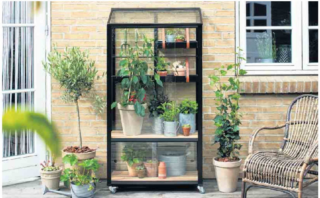
Im Mini-Gewächshaus gedeihen Kräuter und Gemüse auf kleinstem Raum

Es gibt sie mit Folie überspannt, in Form von kleinen Schränken und mit verstellbaren Böden. Unter dem Gewächshaus befestigte Rollen sorgen zusätzlich