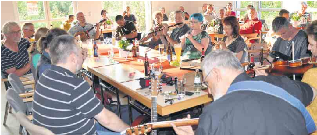
Umrahmt von den begeisterten Zuhörern musizieren die Irish-Sessioneers im oder auch draußen vor dem Gielsdorfer Dorfgemeinschaftshaus.