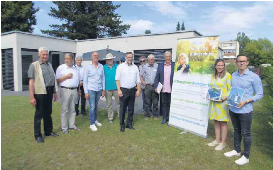
Die Ehrung fand mit zahlreichen Teilnehmern im Garten der Familie Klein in Rheinbach statt.