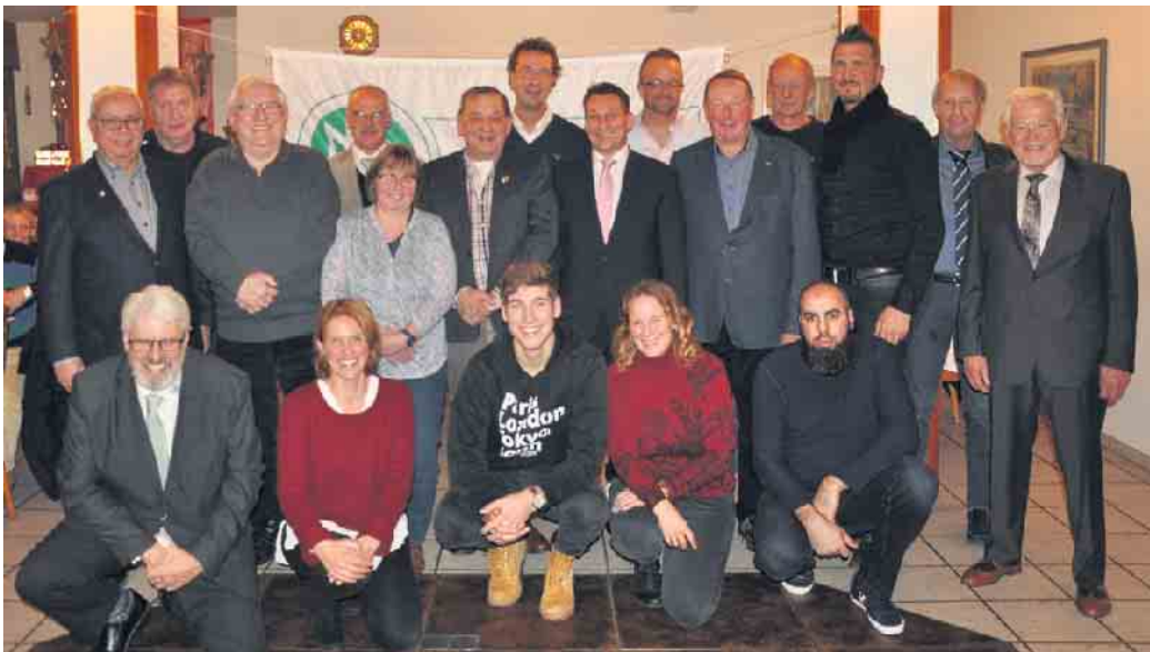
Wie hier im Jahre 2019 herrscht bei den ausgezeichneten Ehrenamtlern im Fußballkreis Bonn Jahr für Jahr große Freude.