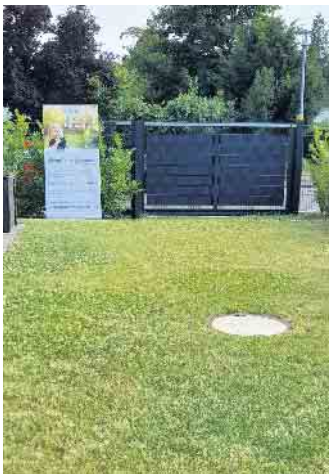
Unter dem Rasen befindet sich das ca. zehn Kubikmeter umfassende Wasserbecken der Eisspeicherheizung.