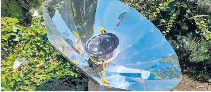
Modell Parabolspiegelkocher.