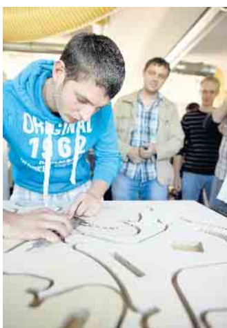
Die Arbeit mit dem Naturmaterial Holz fasziniert die Menschen seit Langem.

den Transport direkt auf die Baustelle verantwortlich. Auch diesen Ausbildungsberuf bieten zahlreiche örtliche Fachhandelsunternehmen an. Unter www.holzvomfach.de/ausbildung etwa gibt es weitere Informationen, Einblicke in die Erfahrungen anderer Auszubildender und Ansprechpartner in den Unternehmen. Mit einer PLZ-Suche können Schulabgänger offene Stellen in der eigenen Region finden. (djd)