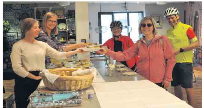
Gern stärkten sich die Radler mit den mediterranen Köstlichkeiten, die das Möbelhaus Kurth offerierte.

Schüller war froh, „dass wir auch dieses Jahr erneut eine solch attraktive Veranstaltung durchführen und gemeinsam genießen konnten. Das Ergebnis ist einfach beeindruckend“. Damit verband sie einen herzlichen Dank an die Partnerbetriebe und alle aktiven Helfer, insbesondere auch an den ADFC. Abschließend gaben alle Beteiligten der Hoffnung Ausdruck, dass im Mai 2024 viele Radler bei der 15. Auflage von „Alfter bewegt!“ erneut in die Pedale treten werden. (WDK)