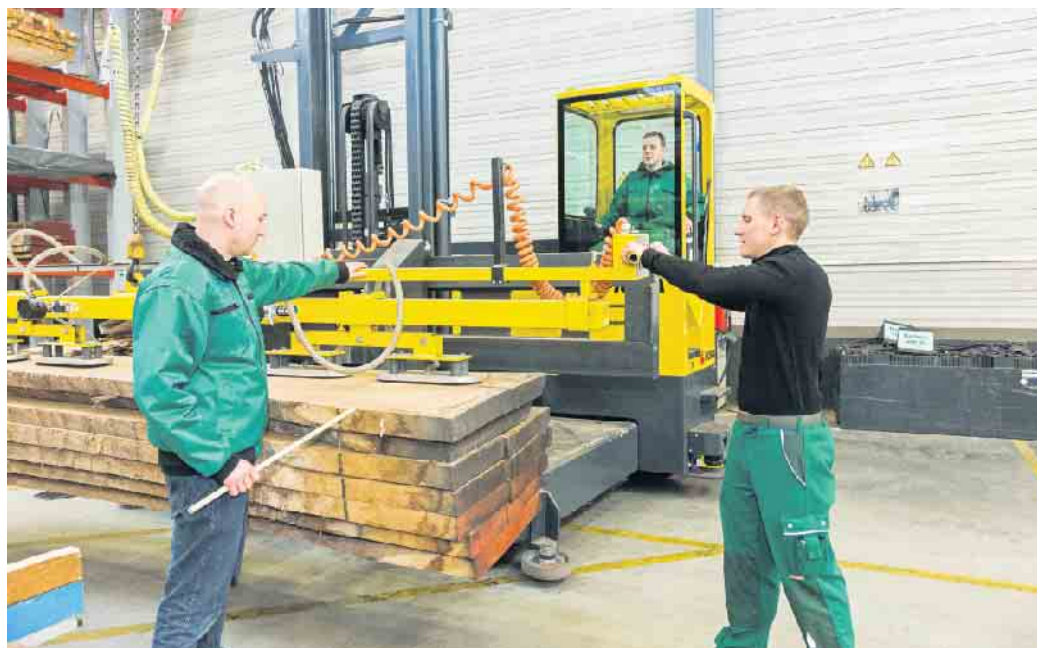
Ob im kaufmännischen Bereich, in der Verarbeitung oder der Logistik: Der Holzfachhandel bietet attraktive Ausbildungs- und Berufsperspektiven.

Ohne komplexe Technik geht auch beim Umgang mit dem Naturmaterial Holz heute nichts mehr. Der Ausbildungsberuf für angehende Kaufleute im Groß- und Außenhandel mit Schwerpunkt Großhandel zum Beispiel wird immer komplexer. Er bietet sehr gute Chancen auf eine Übernahme und kontinuierliche Weiterbildungen sowie Aufstiegsmöglichkeiten nach dem Ende der Berufsausbildung. Neben der Begeisterung für den Werkstoff Holz zählen Kommunikationsgeschick, Teamfähigkeit und Freude am direkten Kommunizieren mit Lieferanten und Kunden zu den Einstiegsvoraussetzungen. Ein gutes Verständnis für Zahlen und wirtschaftliche