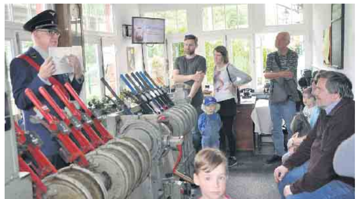
Das Stellwerkmuseum in Witterschlick vermittelt ein unvergessliches Stück Eisenbahn-Romantik.