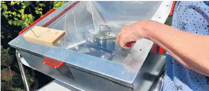
Blick in eine Solarkochbox