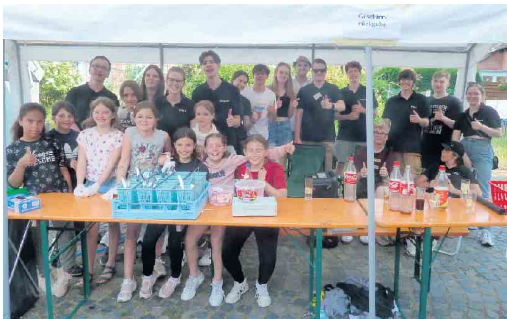
Ein Teil der Messdiener am Spülmobil und der Geschirrausgabe.

Der Arbeitskreis Feste und Begegnungen des Matthäusrates wird Buden und Zelte um das Pfarrheim aufbauen. Viele Gruppen wie z. B. die Messdiener, die Gemeinschaft kath. Frauen St. Matthäus, das Kath. Familienzentrum, die Öffentliche Bücherei St. Matthäus, Chor und Orchester St. Matthäus, der Männergesangsverein Concordia Alfter, die Sozial- und Caritasgruppe, die St. Hubertus-Matthäus Schützenbruderschaft und natürlich Kirchenvorstand und Matthäusrat sorgen für ein abwechslungsreiches und unterhaltsames Programm.