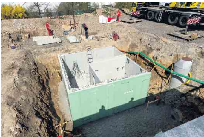
6,50 mal 6,50 Meter Baugrube reichen für einen kompakten Teilkeller meist schon aus.

Anlagen im Haus nehmen heute schnell zehn Quadratmeter und mehr ein. Das ist Fläche, die vor dem Hausbau irgendwo im Grundriss mit eingeplant werden muss. „Am besten im Keller, um den Wohnbereich zu entlasten und wertvolle oberirdische Fläche anderweitig nutzen zu können, zum Beispiel für ein Homeoffice“, so Wetzel. Außerdem können technische Geräte Geräusche verursachen, die im Keller weniger stören - vor allem dann, wenn das kleine Untergeschoss ohnehin als kompakter Nutzkeller und nicht, wie bei Vollunterkellerungen heute üblich, als zusätzliche Etage zum Wohnen eingeplant wird. Die effizienten Teilkeller aus wasserundurchlässigem WU-Beton werden industriell vorgefertigt und sind häufig schon am ersten