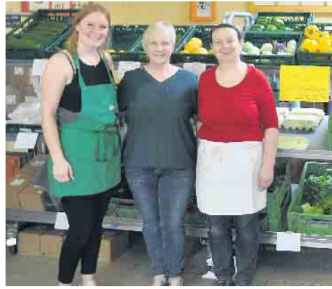
„Heute Selbstbedienung“ hieß das Motto im Hofladen Mandt.

mit der Resonanz und Beteiligung zufrieden und versprach, eine erneute Beteiligung 2024 zu prüfen. Beim Stellwerkmuseum Bahnhof Witterschlick waren der „Lumerland-Brunnen“, die Modellbahn, das Stellwerkmuseum und das Trauzimmer zu besichtigen. Das Alanus Café der Alanus Hochschule & Werkhaus (Campus I, Johannishof), das kurz vorher seine Sommersaison eröffnet hatte, lud zum Verweilen bei Kunst, Natur und Genießen ein. Dort informierte auch der RVT über die Rheinische Apfelroute und weitere Erlebnistouren und -stationen in der Region. Anschließend ging es zurück nach Alfter-Ort. Dort bot der Hofladen Mandt erntefrischen Produkte aus eigenem Anbau und die dort beheimatete Gelis Kaffee Ecke verwöhnte die Gäste mit leckerem Kaffee und Kuchen. Den Abschluss bildete dieses Jahr das „ Haus der Alfterer Geschichte “, wo sich dessen Arbeitskreise mit der Ausstellung „Geschichte lebt - Vom Wasser bis zum Rebellenblut“ präsentierten.