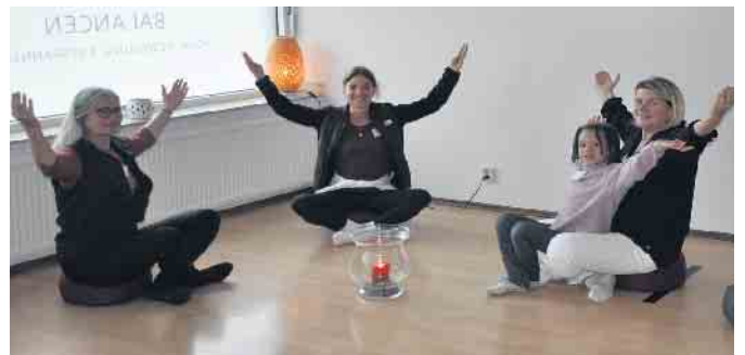
„Finde Deine Balancen“ - das Balancen Studio bot Ruhe, Entspannung und Erholung.

gann diese nicht in Alfter-Ort, sondern am Apfeltor in Oedekoven. Der 2018 gegründete Verein Heimat- und Naturschutz Oedekoven präsentierte seine