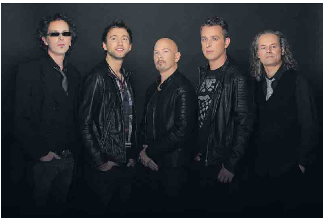
Queen-Klassiker mit individueller Note: Queen May Rock beim Stadtbezirksfest