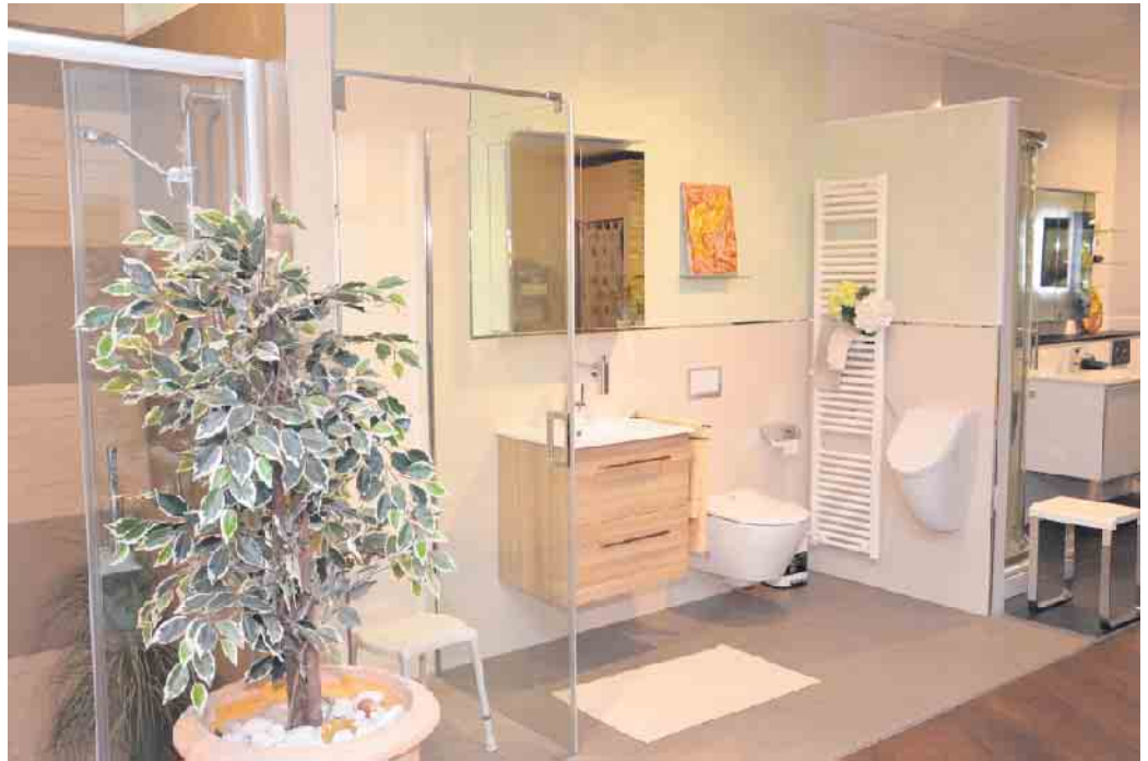
Ein Blick in die Badausstellung.

Komplettiert wird das Team durch die Fa. Frank Bornmann Monta-