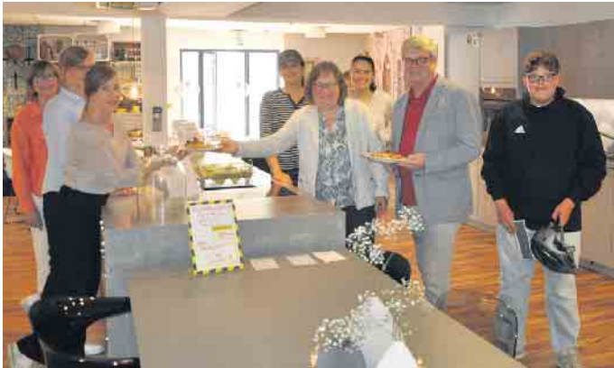
Gern stärkten sich die Radler mit frühlingsfrischen Köstlichkeiten, die das Möbelhaus Kurth offerierte.

verarbeitung. Abschließend ließ sich der erlebnisreiche Tag beim Stellwerkmuseum Bahnhof Witterschlick mit der Besichtigung des „Lummerland-Brunnen“, des