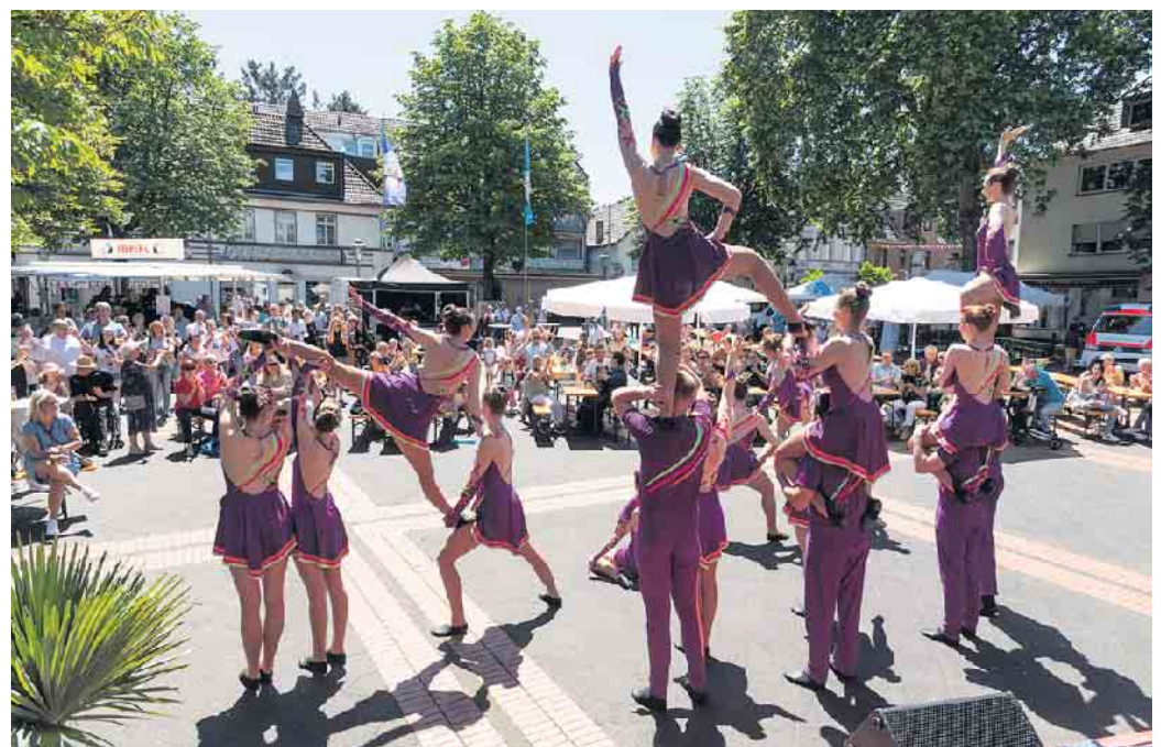
Impressionen vom Stadtbezirksfest 2022.

„Vom 14. bis zum 16. Juni wird es in der Duisdorfer Fußgängerzone wieder hoch her gehen, so viel ist klar. Schließlich hat die WGH Profiveranstalter beauftragt, die Organisation und die Umsetzung zu übernehmen. JK-Agentur und Eventcrew sind alte Hasen, wenn es um Stadtbezirksfeste geht. Und