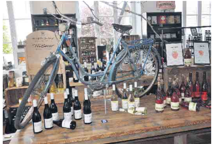
Die Genuss-Schule Alfter stand ganz im Zeichen der Fahrradtour.

Pfarrei Sankt Matthäus Alfter. Nächste Station war das Möbelhaus Kurth (Alfter-Ort), wo neben der Präsentation der neuesten Küchen- und Wohntrends frühlingsfrische Köstlichkeiten die Radler für die folgenden Etappen stärkten. Anschließend bot das Balancen-Studio in Oedekoven, das erstmals bei „Alfter bewegt“ dabei war, Möglichkeiten zur mentalen und körperlichen Entspannung. Der Naturhof Wolfsberg (Impekenoven) gab bei sachkundigen Betriebsführungen und Treckerfahrten in die Apfeldfelder Einblicke darin, was ein ökologisch arbeitender Obstbaubetrieb eigentlich macht. Dort informierte außerdem der RVT über die Region Rhein-Voreifel, insbesondere die Rheinische