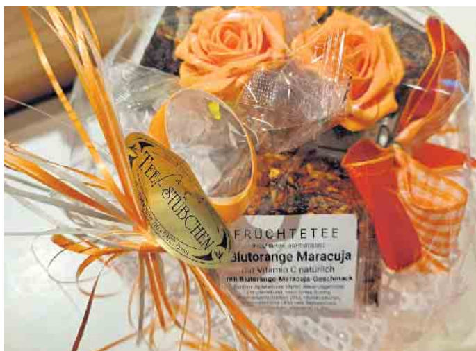
Ein Strauß, der nicht verwelkt: Teestrauß im Teestübchen.