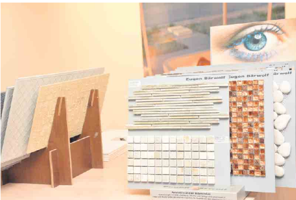
Alles für Wand und Boden in der Ausstellung von Fliesen Bauch.