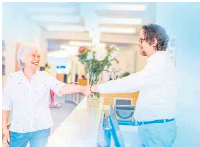
Freundlicher Empfang und kompetente Beratung bei Köttgen Hörakustik

petenz, Einfühlungsvermögen und im fachlichen Austausch mit den HNO-Praxen streben sie den bestmöglichen Ausgleich der Hörminderung an. Die Mitarbeitenden bei Köttgen Hörakustik hören Ihnen zu und nehmen sich Zeit für Sie! koettgen-hoerakustik.de CSH