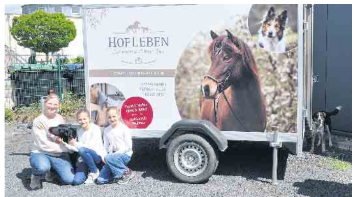
Bei HofLeben lohnte sich ein Stopp für Hund & Halter, Pferd & Reiter.