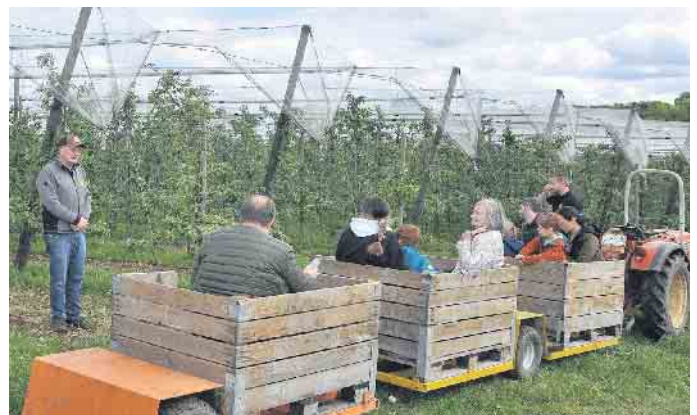
Die Treckerfahrt in die Apfeldfelder ist jedes Mal ein Hit beim Naturhof „Wolfsberg“.