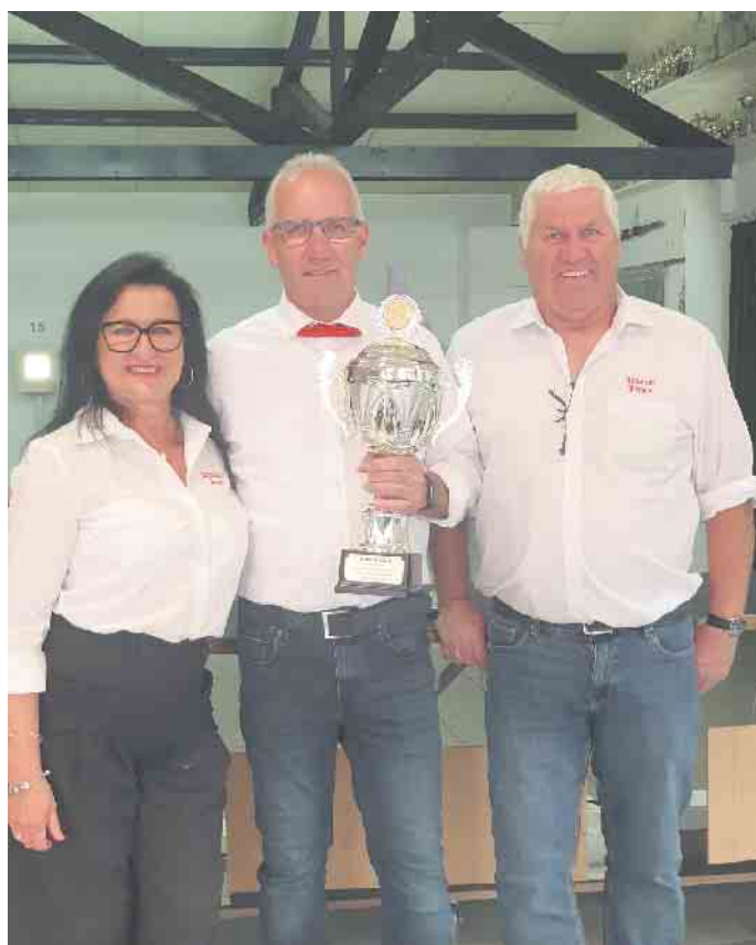
Ortsvereinswanderpokal ans desg. Prinzenteam 2025