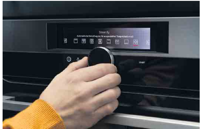
Sous-Vide-Garen wie ein Professional, Braten und Backen mit Steam-Technologie: Einfach die gewünschte Temperatur auswählen. Der Backofen fügt dann ganz automatisch die richtige Dampfmenge hinzu.

persönlichen Vorlieben sollen vielleicht mehrere Einbaugeräte neben- oder übereinander integriert werden wie beispielsweise ein Multifunktionsbackofen zusammen mit einem Kompakt-Mikrowellengerät und Kompakt-Kaffeefullautomaten plus Wärmeschubladen. „Das ermöglicht noch mehr Flexibilität und Vielfalt bei der Essenszubereitung. Insbesondere wenn täglich für mehrere Personen, zu unterschiedlichen Zeiten, sehr abwechslungsreich, besonders vitaminschonend gekocht und regelmäßig gebacken wird.“ Steht nicht viel Platz zur Verfügung, sind Kombi-Produkte eine gute Wahl - z.B. ein Backofen mit Dampfunterstützung oder ein 3in1-Modell (Backofen mit Dampfgerät und Mikrowelle). „Weitere Auswahlkriterien“, so Volker Irlé, „beziehen sich auf die höchst individuellen Wünsche und Ansprüche in puncto Ausstattung/Extras, Funktionalität, Optik, Komfort, Ergonomie und Konnektivität.“ Neben klassischen Beheizungsarten wie Heißluft, Ober-/Unterhitze und Grill bieten