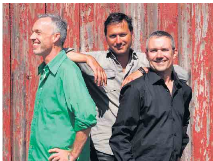
Urlaub für die Ohren: Fiesta Poets beim Stadtbezirksfest

Ab 19 Uhr am Samstagabend spielt Queen May Rock auf dem Schickshof, die mehr als eine reine