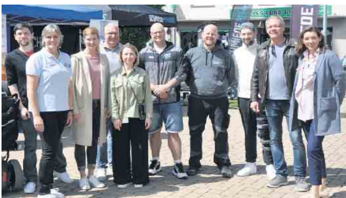
Die Repräsentanten des Gewerbevereins und der Aussteller freuten sich über eine gut besuchte REGIONAL-ALFTER auf dem Dorfplatz

bewegt“, das Ladengeschäft mit besonderen und hochwertigen Produkten für Hunde und Islandpferde. Danach ging es >>