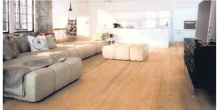
Parkett: nachhaltig, langlebig, umweltfreundlich.

Das Holz der Bäume wird zum Beispiel für Parkettböden verwendet. Da so ein Boden aus Echtholz mehrfach aufgefrischt und renoviert werden kann, hält er mitunter mehrere Jahrzehnte und schont so wertvolle Ressourcen. „Wer das vielleicht älteste Baumaterial in den eigenen vier Wänden nutzt, hilft damit auch dabei, Treibhausgasemissionen zu verhindern, die bei der Produktion anderer Baumaterialien entstünden“, so Schmid. „Durch einen Parkettboden können negative Einflüsse auf das Klima so dauerhaft reduziert werden.“ Für einen Parkettboden stammt das Holz aus nachhaltiger europäischer Forstwirtschaft. Nachhaltig, weil stets weniger Holz geerntet wird, als im Wald gleichzeitig nachwächst. So ist immer sichergestellt, dass die Wälder auch in Zukunft ihre