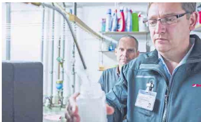
Wasserproben im Rahmen der Legionellenprüfung dürfen nur von akkreditierten Stellen entnommen werden.