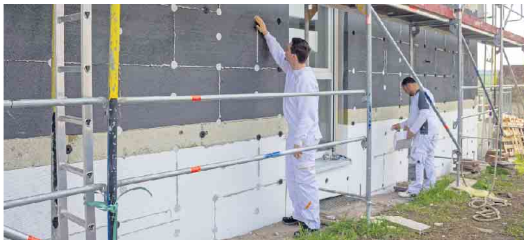
Angesichts hoher Energiepreise amortisiert sich das energetische Sanieren noch schneller.

Bei hohen Energiekosten amortisiert sich das Sanieren noch schneller