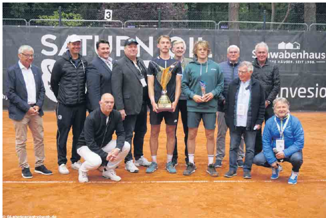
Veranstalter, Organisatoren, Publikum und Tennis-Profis freuen sich auf die 2. Auflage der Saturn Oil Open.