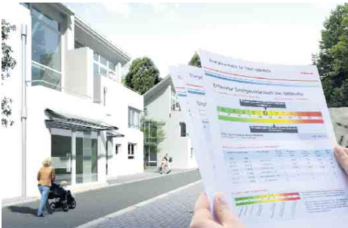
Energieausweise haben eine Gültigkeit von zehn Jahren. Verpflichtend ist ein aktuell gültiger Ausweis bei Vermietung oder Verkauf einer Immobilie.