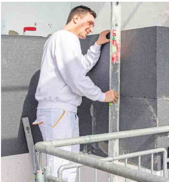
Dämmen durch den Profi: Die fachgerechte Ausführung stellt Langlebigkeit und Wirksamkeit des Wärmeschutzes sicher.