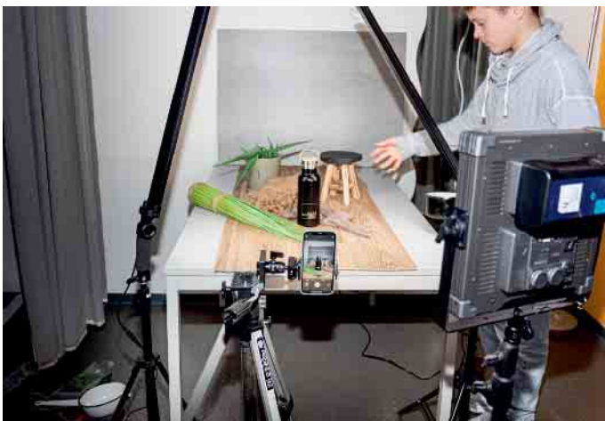
Im hauseigenen Fotostudio wurde eifrig dekoriert.

Bei leckerer Pizza ging ein aufregender und abwechslungsreicher Tag zu Ende.