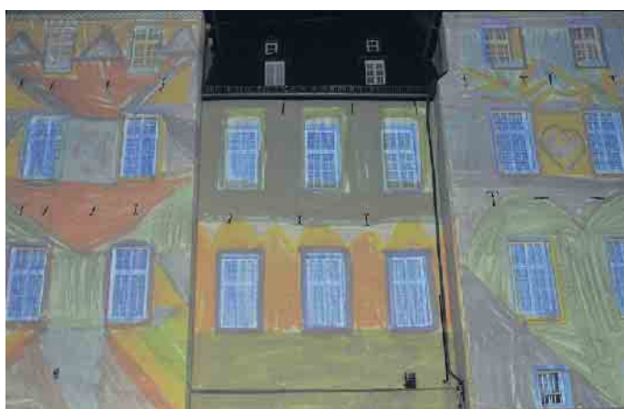
Die Illumination des Schlosses im Rahmen des Events „Schlosszauber“ war 2022 ein außergewöhnlicher kultureller Höhepunkt in Alfter. Eine Fortsetzung ist für Sommer/Herbst dieses Jahres geplant.