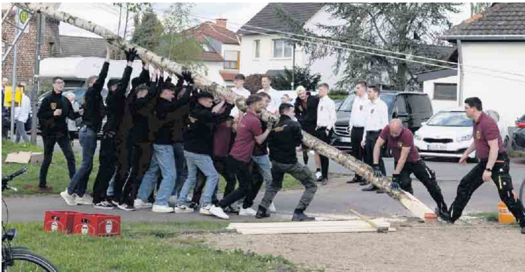
Die Junggesellen stellen den Dorfmaibaum

Viele Besucher bei der Gielsdorfer Mainacht