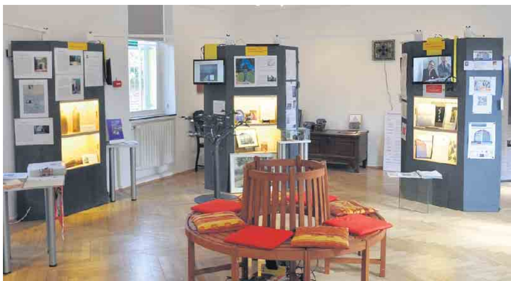
An insgesamt sechs Informationssäulen stellen die Arbeitskreise in Wort und Bild sowie mit eindrucksvollen Exponaten und elektronischen Medien ihre Themen vor.

des offenen Denkmals“. Der 2019 gegründete Arbeitskreis „Donnerstag-Gesellschaft 2.0“