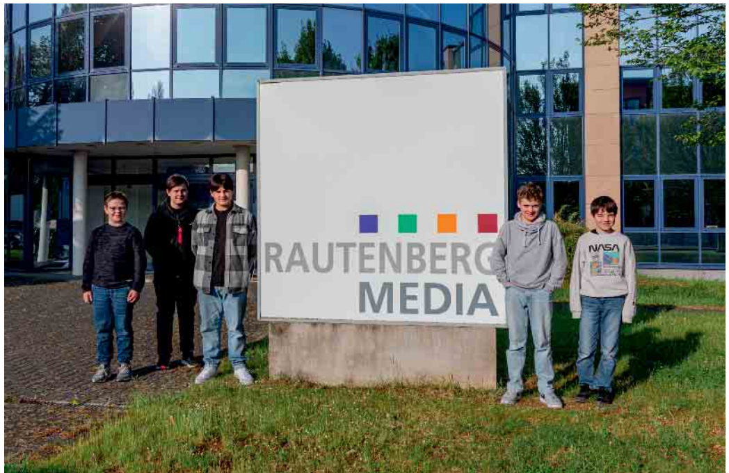
Boys' Day bei Rautenberg Media