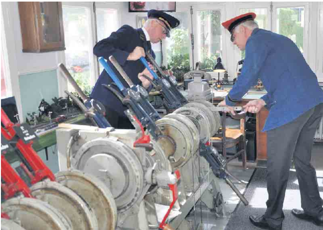
Das Stellwerkmuseum Bahnhof Witterschlick ist immer einen Besuch wert.