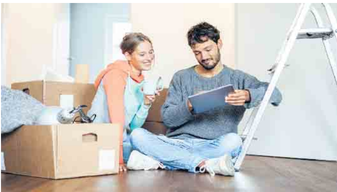
Viele frisch verheiratete Paare träumen davon, ein eigenes Haus zu bauen.

bund e.V. (BSB) gibt Tipps. Gute Vorbereitung ist der halbe Hausbau Ein wichtiger Punkt in der Planung eines Hausbaus ist das Timing. Ein Hausbau erfordert viel Zeit von den Bauherren. Wenn gerade beide Partner mit vollem Einsatz auf der Karriereleiter nach oben streben oder die Geburt eines Kindes bevorsteht, kann es sinnvoll sein, das Bauprojekt nach hinten zu verschieben. Ist das nicht möglich, sollten Reserven vorausgeplant und Zeitpläne nicht zu knapp kalkuliert werden. So lassen sich unter Umständen Großeltern oder Verwandte für die Kinderbetreuung einspannen. Bei der Wahl des Haustyps und des Baupartners sollten sich Paare eng abstimmen, damit die Wohnwünsche am Ende auch wirklich zusammenpassen. Bei