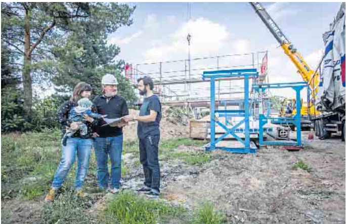
Die Begleitung des Hausbaus durch einen unabhängigen Bauherrenberater kann jungen Ehepaaren den Stress auf dem Weg in die eigenen vier Wände abnehmen.

aller Liebe ist oft Kompromissfähigkeit gefragt. Ein unabhängiger Sachverständiger, zum Beispiel ein BSB-Bauherrenberater, kann hier beratend zur Seite stehen, verschiedene Hausangebote vergleichen und den frischgebackenen Eheleuten erklären, was sich dahinter verbirgt.