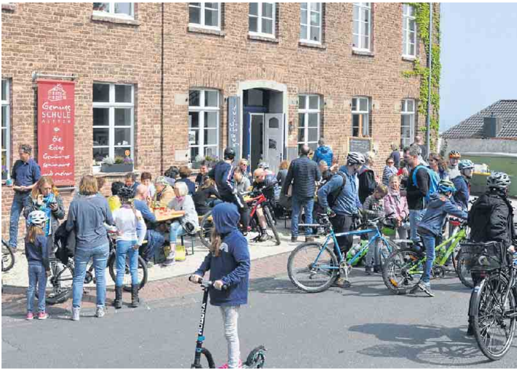
Eine Rast bei der Genuss-Schule Alfter ist immer eine willkommene Unterbrechung der Radtour.

Alfter-Ort. Dort bieten der Hofladen Mandt (Taubenweiherweg 4) , erntefrischen Produkte aus eigenem Anbau und die dort beheimatete Gelis Kaffee Ecke Kaffee und Kuchen, gebacken nach alter Handwerks-tradition. Den Abschluss bildet dieses Jahr das „Haus der Alfterer Geschichte“ (Hertersplatz 19) , wo sich seine Arbeitskreise mit der Ausstellung „Geschichte lebt - Vom Wasser bis zum Rebellenblut“ präsen-tieren. Natürlich können die Stationen auch in beliebig anderer Reihenfolge angefahren werden. Ausdauer wird auch dieses Jahr wieder belohnt: Wer alle Stationen besucht und sich dort die Teilnehmerkarte abstem-peln lässt, kann beim Stempel-karten-Gewinnspiel mit etwas Glück einen der fünf attraktiven Preise der Alfterer Betriebe gewinnen. (WDK)