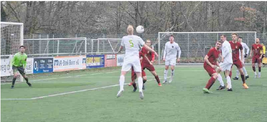
Gegen Neunkirchen-Seelscheid stand die Alfterer Defensive (rote Trikots) sicher und ließ keinen gegnerischen Treffer zu.