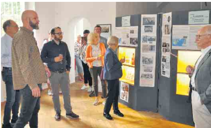
Das Haus der Alfterer Geschichte gibt mit seinen sehenswerten Ausstellungen den Besuchern aus nah und fern Einblicke in das Leben früher und heute.