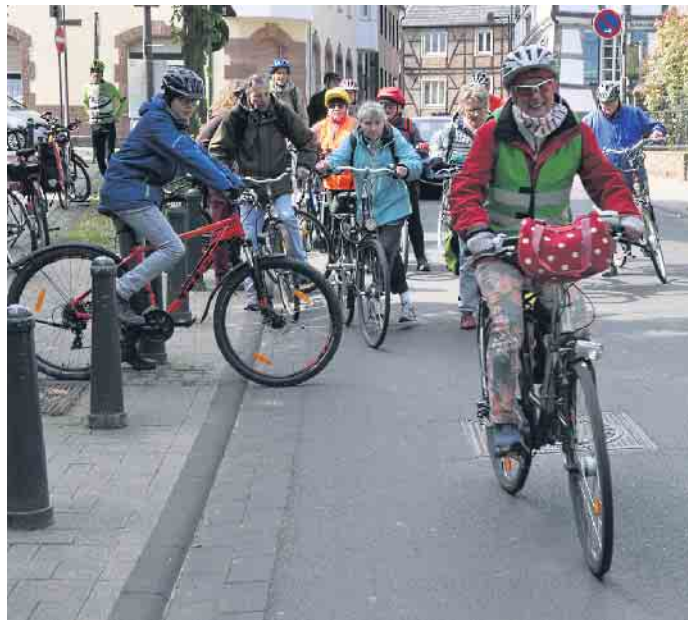
Traditionsgemäß startet die Fahrrad-Tour vor der Öffentlichen Bücherei am Hertersplatz in Alfter-Ort.

es anschließend bei der Genuss-Schule Alfter (Brunnenstraße 44) , wo eine Schulspeisung mit Tradition auf dem Programm steht. Anschließend lockt die Galerie Conrad (Oberdorf 14) mit einer Skulpturenausstellung im Garten und einer Kunstausstellung. Der Naturhof Wolfsberg (In der Asbach 44) lockt mit 40 selbstgebackenen Kuchen und informiert bei