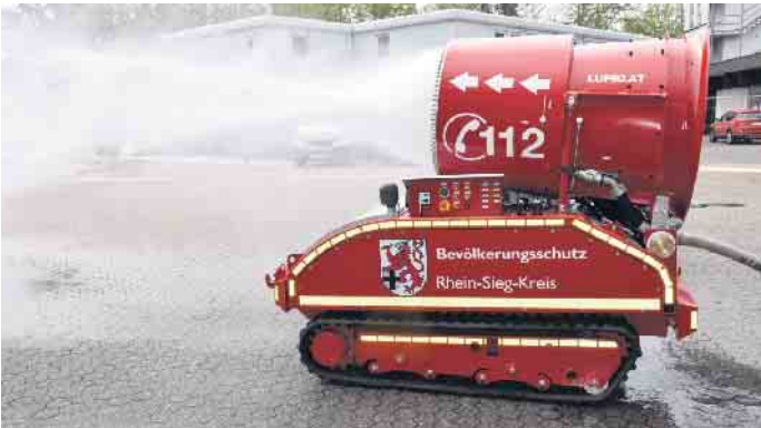
Das Löschunterstützungsfahrzeug LUF 60 im Einsatz.

Das LUF 60 soll die lebenswichtige Arbeit der Feuerwehren im Rhein-Sieg-Kreis wirksam unterstützen.