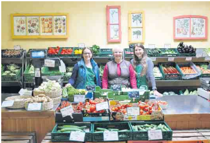
Der Hofladen Mandt verwöhnt mit frischem und schmackhaftem saisonalem Gemüse und Obst seine Kunden.