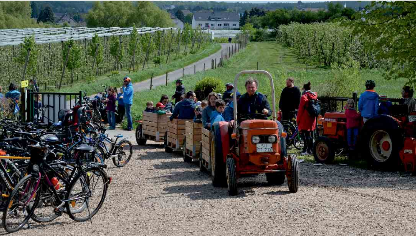
Die Treckerfahrten in die Obstgärten sind für Groß und Klein immer wieder ein ganz besonderes Erlebnis.