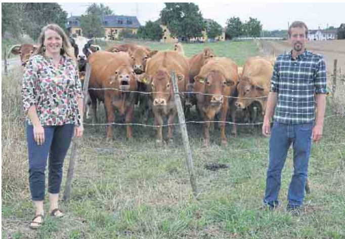
Erstmals ist die Rinderzucht Hof Frizen (Burg Ramelshoven) bei der Frühlingsaktion dabei.