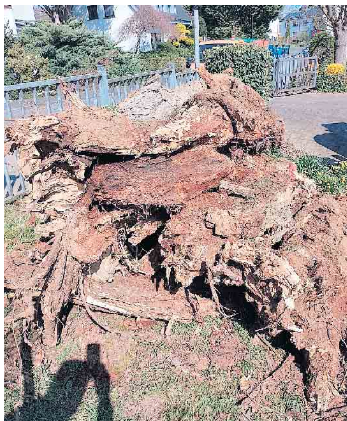
Robinie mit Pilzbefall am Friedhof Impekoven

gen war jetzt nicht mehr intakt und die Fäule sehr weit vorgeschritten. In einem Gutachten, welches die Gemeinde 2015 beauftragt hatte, wurde die Reststandzeit des Baumes auf maximal 15 Jahre geschätzt. Laut Baumschutzsatzung der Gemeinde Alfter legt die Baumschutzkommission jetzt den Rahmen der Ersatzpflanzung fest. Es wird geprüft, ob eine Nachpflanzung eines großen Laubbaumes an derselben Stelle möglich ist. Die Beratung darüber ist noch nicht abgeschlossen. Das Ergebnis wird zu einem späteren Zeitpunkt bekannt gegeben, da die Ersatzpflanzungen erst im kommenden Herbst erfolgen werden.