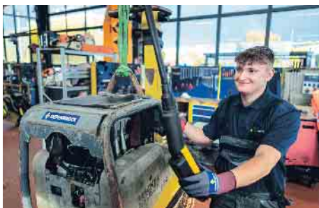
Wichtige Aufgabe - Land- und Baumaschinenmechatroniker halten Maschinen am Laufen und sind verantwortlich für deren Wartung und Reparatur.

Ohne moderne Technik geht auf dem Bau nichts. Land- und Baumaschinenmechatroniker sorgen dafür, dass leistungsstarke Maschinen stets einsatzbereit sind: Sie halten die Technik am Laufen und sind verantwortlich für deren Einrichtung, Wartung und Reparatur. Damit leisten sie einen wichtigen